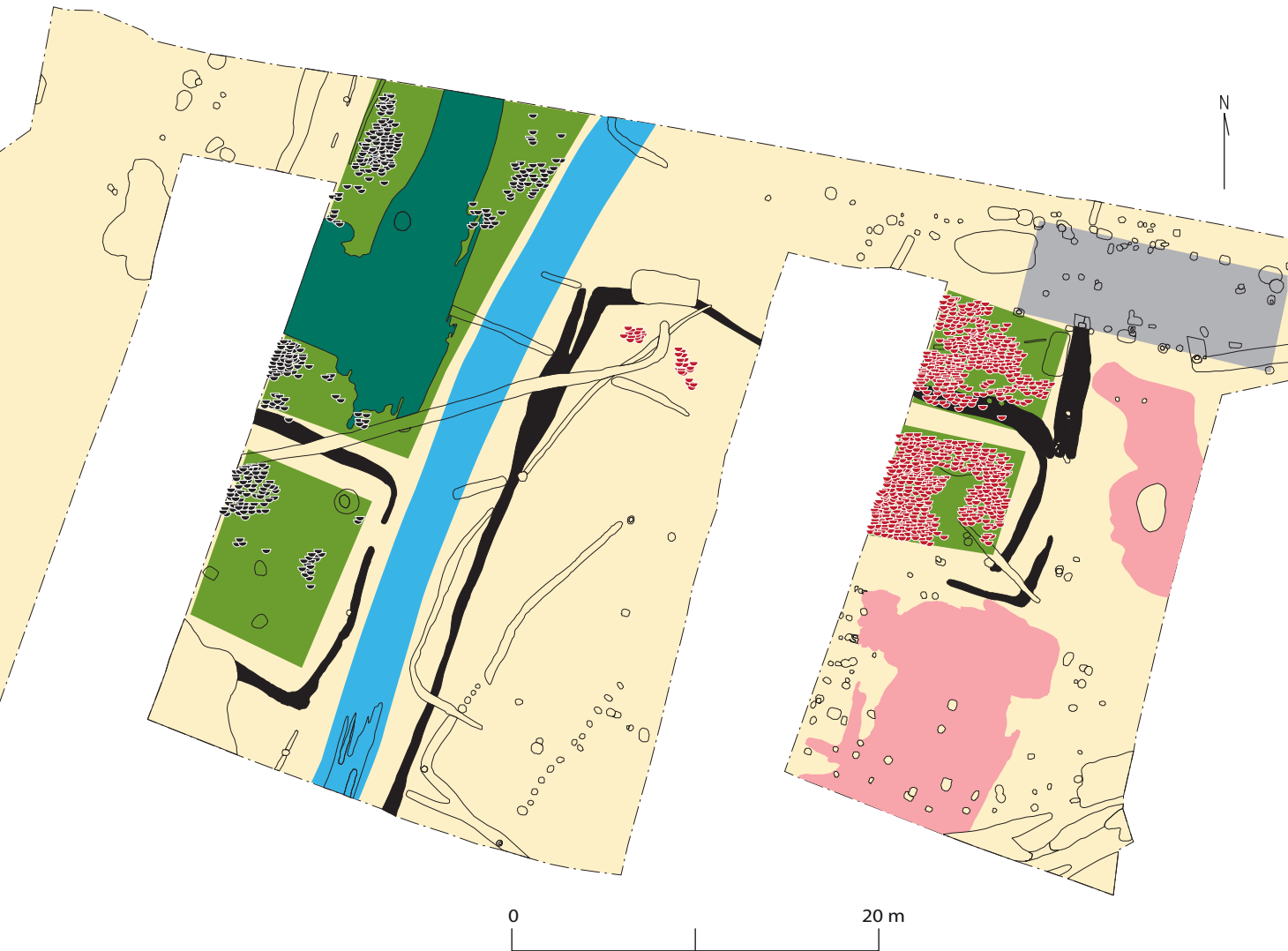
Plan af udgravningsområdet i Henneby med skematiske markeringer af spadegravede haver (lysegrøn), pløjning i have mod vest (grøn), grøfter omkring haver (sort), formodede møddinger (rosa), middelalderlig hustomt (grå) samt vej (blå).