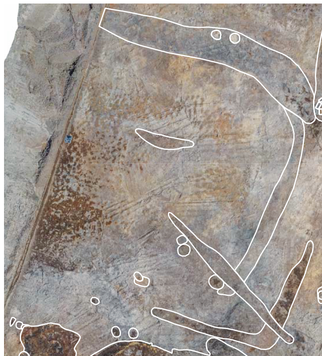
Spadespor i have, tæt på.

Det første, vi med undren opdagede på udgravningsområdet i Henneby, var spættede områder med utallige grå og røde pletter i flyvesandslagene. Efterhånden som vi fik fladen afrenset, blev det klart, at pletterne flere steder samlede sig i firkantede grupper, der var omgivet af grøfter. Og herved begyndte en forklaring på iagttagelserne at forme sig. Kunne det hele være spor af gravning med spader? Og ja, det må være den rigtige tolkning, at vi har fundet bevarede spor af gravning i nogle haver, der har været afgrænset af grøfter. Lige inden for grøfterne er der de fleste steder fravær af spadespor, hvilket kan forklares ved, at her stod nu forsvundne tørvediger. Grøfter og diger skulle, måske hjulpet af flethejn, sikre, at husdyr ikke fik adgang.