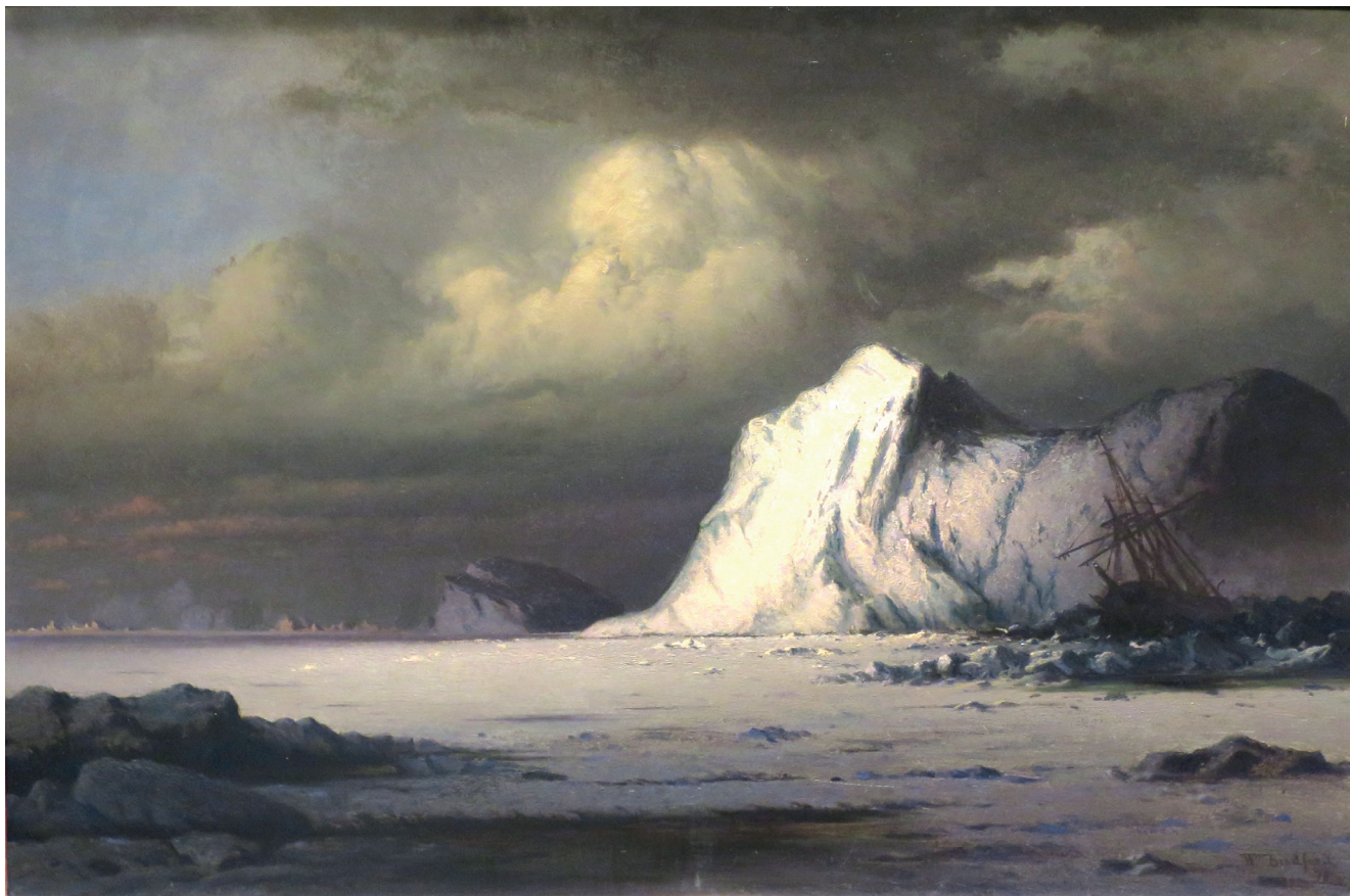
Fascinationen af de rædsler og den død man kunne lide i Arktis spillede en stor rolle i forestillingerne om polarhelte. Maleri: Abandoned in the Arctic Ice Fields af William Bradford, 1876. Olie på lærred. High Museum of Art. Wikimedia Commons.

De grundlæggende kvaliteter for borgerskabets mand var selvbeherskelse, mod, viljestyrke, udholdenhed, standhaftighed, god opførsel, arbejdsomhed og erobring. 5 Også kroppen var i fokus. En sund krop afspejlede en god karakter