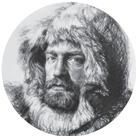
Niels Peter Høeg Hagen portrætteret som en yderst mandig polarhelt. Han sidder med et fast, beslutsomt blik, mandigt fuldskæg og en næsten håndgribelig viljestyrke i pelsdragten, der kendetegnede polarforskeren.