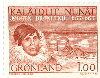
Jørgen Brønlund blev i hundredeåret for sin fødsel hædret med et frimærke.

Hans død rummede al den arktiske rædsel og selvopofrende mandighed, man kunne ønske sig som læser hjemme i Danmark. Den styrke og vilje, han havde udvist ved at finde depotet for at sikre ekspeditionens resultater, blev understreget igen og igen. Særligt fortællingen om, at han vidste, at han skulle dø og kun forcerede polarnatten af pligt for ekspeditionen fascinerede. Det kunne næsten ikke blive mere mandigt og heltmodigt. Ikke alene havde han med sin viljestyrke og sin pligtfølelse kæmpet sig frem til depotet i en frygtelig tilstand og under frygtelige