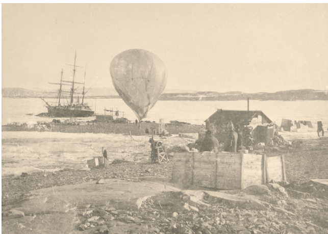
Som en del af de videnskabelige undersøgelser blev der året rundt sendt vejrballer op.