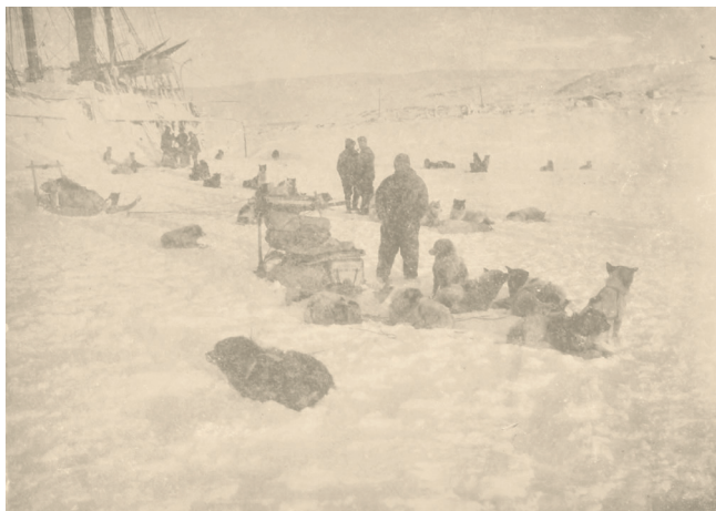
Skibet Danmark ligger dækket af sne, mens et slædehold gør sig klar til ekspedition i oktober 1906.

For at lade læseren forstå, hvorfor så få undsætnings-ekspeditioner blev sendt afsted og hvor meget en sådan