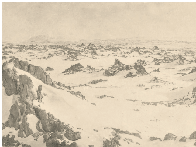
Selv i sne var landskabet ofte svært ufremkommeligt. Maj 1908.

Ud fra hvad aviserne skrev må svaret være nej. Den sparsomme kritik af Mylius-Erichsen gik først og fremmest på at ekspeditionen var dårligt forberedt og at han som leder kunne begå den fejl at køre forkert. 26 Kun en enkelt gang blev det i pressen kaldt "...det rene Hasardspil med tre menneskers liv". 27 Det afgørende her – og for hele ekspeditionen – var, at hans beslutning havde resulteret i at målet om at kortlægge Grønland var nået. 28 Det havde kostet tre