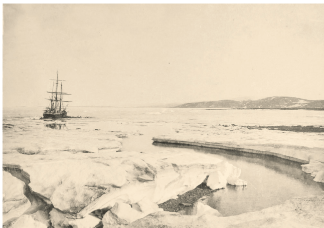
Skibet Danmark i isen ved Danmarkshavn, forår 1908.

Men heldigvis for Mylius-Erichsen var andre klar til at tegne et mandigt portræt af ham som polarforsker. Lovprisningen af hans viljestyrke, hans mod, hans ranke skikkelse, hans energi og virkelyst, hans uselviske dedikation til den store opgave, hans evner som slædekusk og leder ville næsten ingen ende tage. Ingen kunne være i