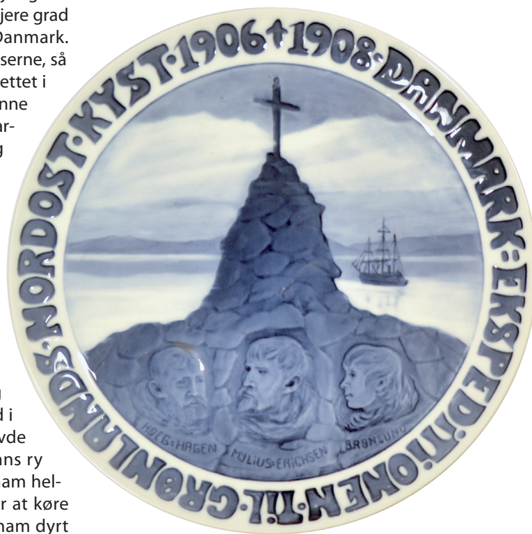
Danmark-ekspeditionen og de tre døde deltagere blev hædret med flere mindesmærker. Her en platte fra Den Kongelige Porcelænsfabrik, der viser den mindevarde, de overlevende opførte i Danmarkshavn.