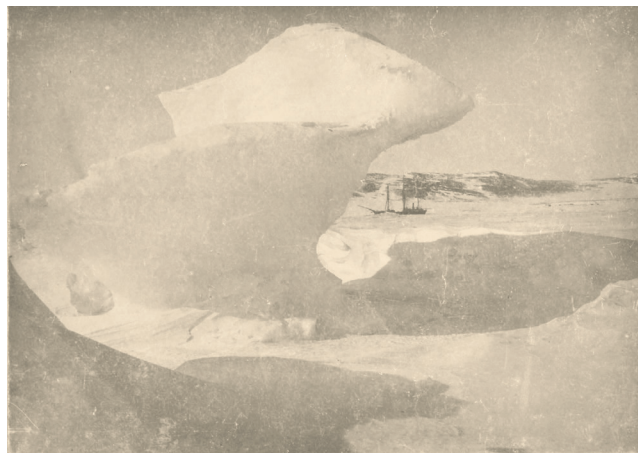
Isbjerg ved Danmarkshavn.