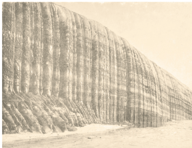
Isen kunne både forbinde og adskille. Havisen gjorde rejser med hundeslæde mulige langs kysten, mens indlandsisen og dens bræer kunne være en uoverkommelige udfordring med de stejle isvægge. Maj, 1908.

mennesker livet, men de døde en ærefuld død, idet de bidrog til videnskaben og Danmarks ære. Idet den overmodige beslutning havde givet resultater, var den blevet modig. Det var ikke dumt – det var mandigt og helt modigt.