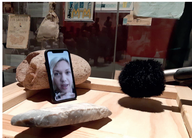
Coronavenligt tv-indslag på TV MidtVest, optaget i Holstebro Museums udstilling, om Ringkøbing-Skjern Museums Coronainsamling.

I slutningen af marts blev der endelig åbnet en dør; de store kulturinstitutioner kunne nu også få en bid af hjælpepakkerne, hvis man altså sendte sine medarbejdere hjem. Og hvor hyggeligt det end måtte lyde at have tid til at nyde foråret og gå i haven, så betød det, at de hjemsendte medarbejdere intet – som i absolut intet – arbejdsrelateret