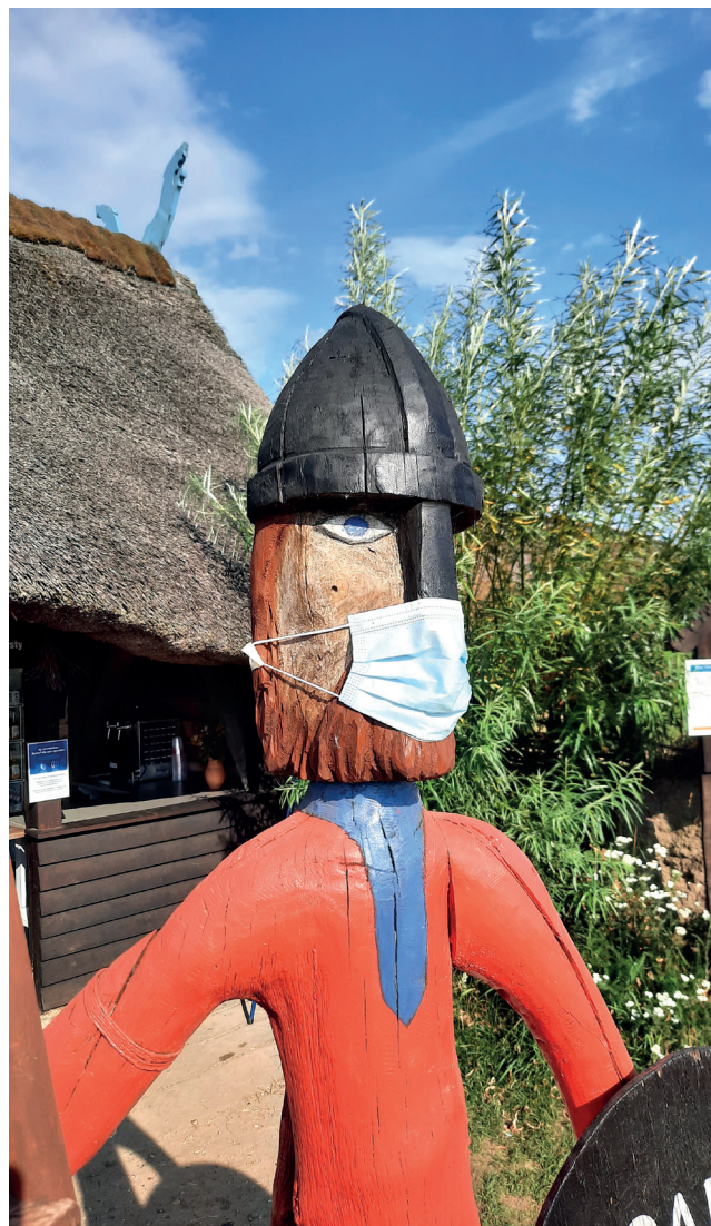
Nye restriktioner har i hele 2020 ramt os. I efteråret gik vi på museet fra at anbefale mundbind, til det blev et krav fra myndighedernes side, til selv at sælge mundbind med logo. Her er det en af vikingerne – dog af træ – på Bork Vikingehavn, der bærer de nu så ikoniske blå mundbind.

På Ringkøbing-Skjern Museum har vi gennem de seneste måneder været så heldige, at mange har støttet og