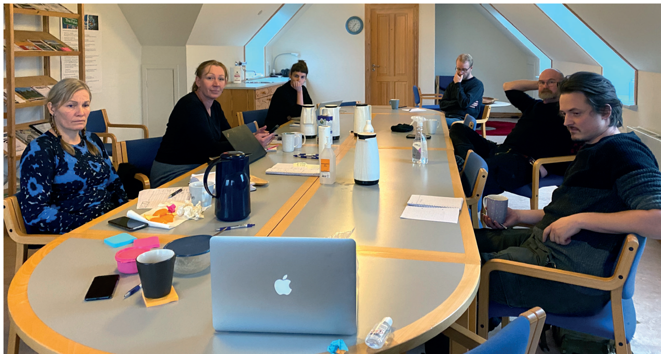
Den 10. december 2020. Museets formidlere blev afbrudt i et møde, da der igen var pressemøde. Her fik vi at vide, at museet endnu en gang skulle lukkes ned.