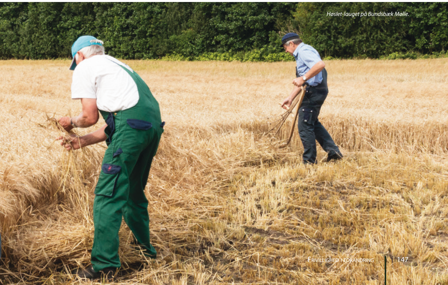
Høstet-lauget på Bundsbæk Mølle.

Udviklingen har betydet en professionalisering i vores kommunikationsarbejde og promovring, og har styrket de frivilliges engagementet. En anden erkendelse, som FrivillighedsAkademiet har givet, er, at mange museer gerne vil forbedre deres samarbejde med frivillige, men at