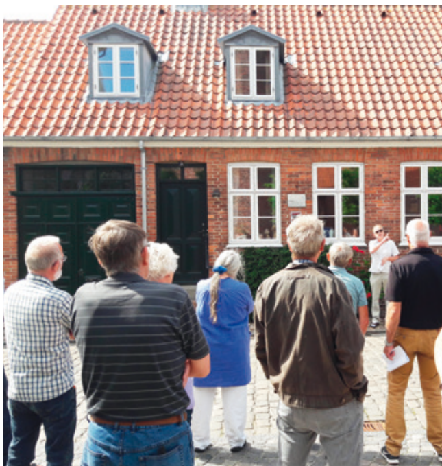
Kursus i byvandring, 2018.