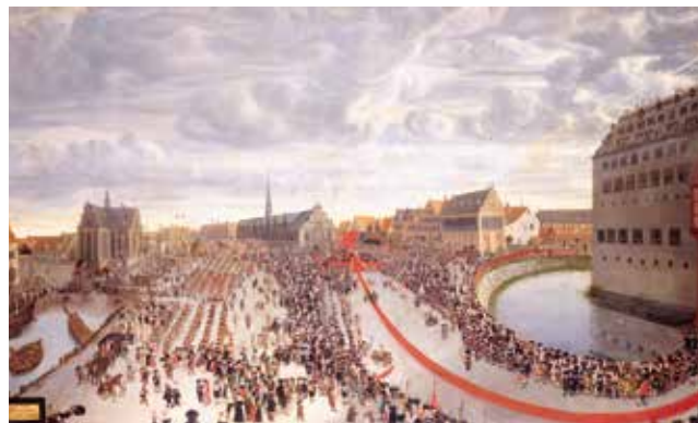
Frederik 3. hyldes som Danmarks arvekonge i 1660. Enevældens indførelse medførte en endnu stærkere centralisering af magten omkring hoffet i København. Det betød også en omlægning af statens finanser. Kronens meget store jordbesiddelser over hele landet blev stærkt reducerede og i stedet blev indført en fast beskatning af befolkningen – især bønderne. Maleri af Wolfgang Heimbach.