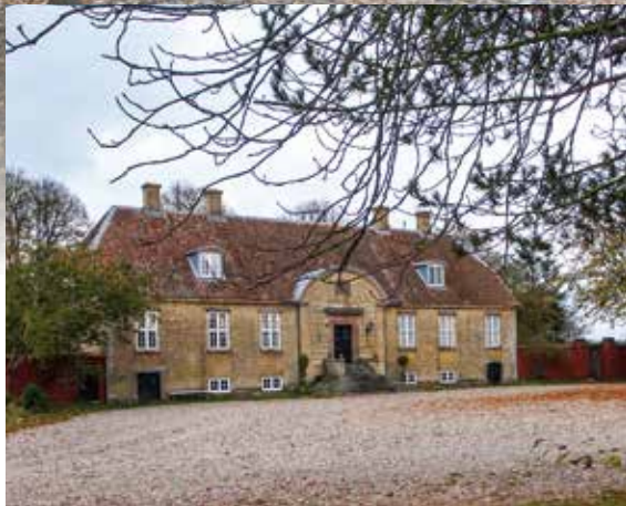
Avlsgården Lunderup havde en markant hovedbygning, som nok var en forvalter værdig. Bygningen var som Nørholm opført i gule mursten fra godsets eget teglværk. Foto: Rasmus Bendix/Vardemuseerne.

Nørholm. Hovedbygningen, der stod færdig i 1780, udstråler store ambitioner. Den traditionelle trefløjede grundform er sløjfet til fordel for en enkeltstående, markant hovedbygning med elementer fra den nye modestrømning klassicismen, der gør bygningen enestående for herregårdsbygninger i Vestjylland. Foto: Rasmus Bendix/Vardemuseerne.