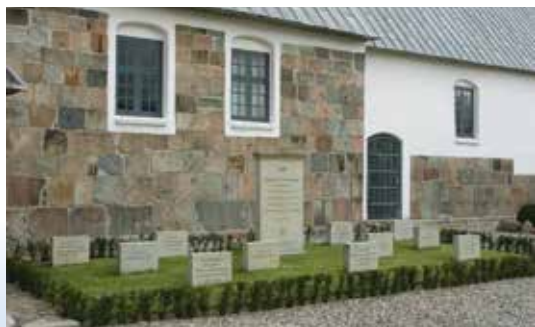
Slægten Juel-Rysensteen holdt som regel til på herregården Lundbæk uden for Nibe, men i 1700-tallet blev indrettet et gravkapel for slægten i tårnet på Bøvling Kirke. Gravkapellet eksisterede indtil 1940, hvor kisterne blev nedsat i en fælles-grav uden for kirken.

Gennem sin militære tjeneste og forbindelsen til hoffet havde Henrik Rüse nået de øverste trin i det nye enevældige hierarki, kun overgået af de nyslåede grever samt