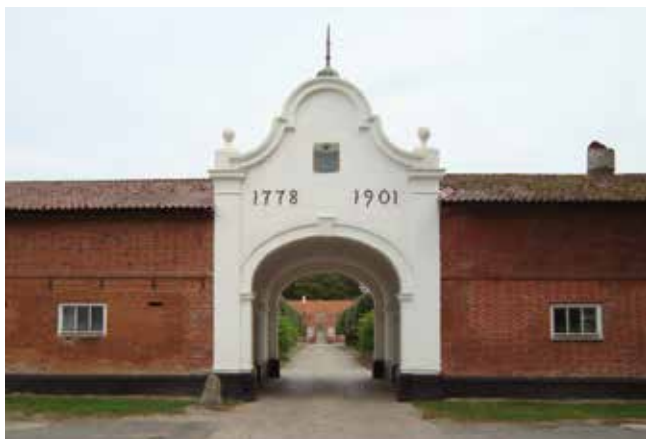
I 1901 blev avlsgården på Ausumgaard fornyet, og der blev blandt etableret en markant gennemkørselsport til gårdspladsen, hvor en allé fører op til hovedbygningen. Årstallene markerer Jermiin-slægtens historiske tilhørsforhold til stamhuset.

økonomien altid var sårbar. Til gengæld blev kontinuiteten sikret ved, at de nye godsejerfamilier fra Limfjorden i nord til Vadehavet i syd var tæt indgiftet med hinanden.