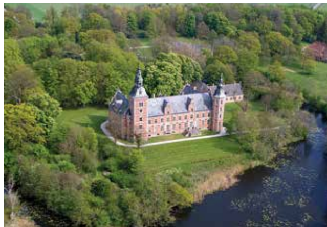
Baroniet Guldborgland på Lolland havde sit hovedsæde på Orebygaard, der i slutningen af 1800-tallet blev ombygget i en festlig slotslignende stil. Baroniet var i hænderne på slægten Rosenørn-Lehn, som i 1920'erne – og efter lensafløsningen – arvede Nørholm fra deres fjerne slægtninge.

var gennem tætte familiebånd knyttet til familien Rosenørn-Lehn fra baroniet Guldborgland på Lolland. Efter frasalg af fæstegårdene under Nørholm investerede han i forbedringer på godserne, og som politisk aktiv både lokalt og på landsplan levede han til fulde op til 1800-tallets (østdanske) godsejerideal. Det er betegnende, at han døde på Lolland under et besøg på sin fætters baroni. Stamhuset gik videre til hans datter, som i 1922 fik opløst stamhuset i henhold til lensafløsningens bestemmelser.