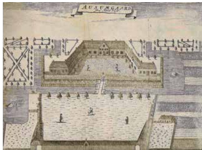
Ausumgaard i Pontoppidans Atlas. På dette stik fra 1769 ses den næsten nyopførte hovedbygning på Ausumgaard omkranset af en voldgrav med svaner og en fornem have i barokstil. Modsat hovedbygningen ses den store avlsgård, der ligeledes var blevet grundigt restaureret i 1760'erne.