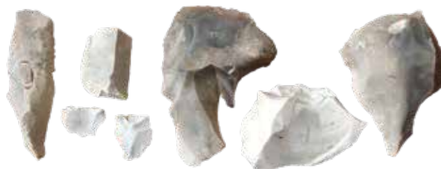
Bearbejdede flintstykker fra den ældste stenalder fundet ved Øster Vrøgum.

den "oprindelige" bund, fremkom syv flintstykker, som alle har været bearbejdet af menneskehånd. Teknikken der er blevet brugt, tyder på, at de folk, der bearbejdede flinten, besøgte stedet i en tør periode i starten af jægerstenalderen for ca. 8000-10.000 år siden, før der blev sø på stedet. Nord for vådbundsområdet lå der i jernalderen en mindre landsby, dateret til ca. 200-500 e.Kr. til det, der kaldes yngre romersk jernalder og ældre germansk jernalder. En gård bestod som regel af et hovedhus og et eller flere udhuse og var afgrænset af hegn. Gårdenes hovedhuse kaldes langhuse og var bygget, så der var plads til dyr i den ene ende, mens folkene boede i den anden. Landsbyen ser ud til at flytte efter ældre germansk jernalder, men hvor den flyttede hen, vil det kun være muligt at afgøre ved at lave udgravninger på de tilstødende marker. I den tidlige middelalder omkring 1100-1200-tallet, opføres der igen et par gårde på marken ved Øster Vrøgum. I middelalderen gik man bort fra at bygge huse med beboelse og stald under samme tag. I stedet byggede man nu separate staldbygninger og lader.