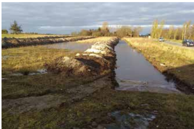
Søgegrøfterne ved Vrøgum først i februar 2018. Det er et ideelt sted at anlægge et regnvandsbassin.

Ved sommerens udgravning stod det hurtigt klart, at stedet har været beboet i flere perioder gennem de sidste mange tusinde år. Undersøgelsen viste, at der på et tidspunkt har været en sø eller mose i den sydligste del af området. Under de nederste tørvelag, på det som kan beskrives som