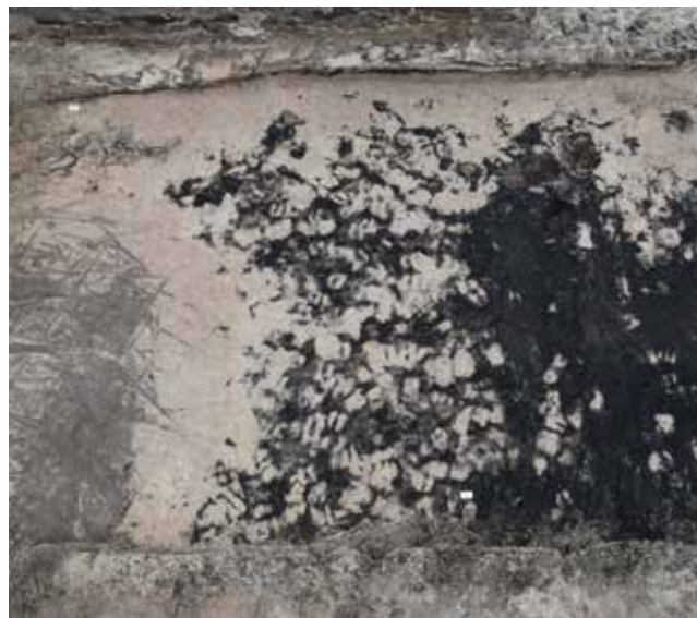
Til højre ses et område med dyrespor fra køer og får. Deres klovaftryk er trådt ned i et vådbundsområde og efterfølgende forseglet af et lag flyvesand. Til venstre ses resterne af et marksystem med ardspor på kryds og tværs, som gik hen over laget med dyrespor.

Der blev udtaget en række jordprøver fra de forskellige jordlag i den profil, som fremkom ved nedgravningen.