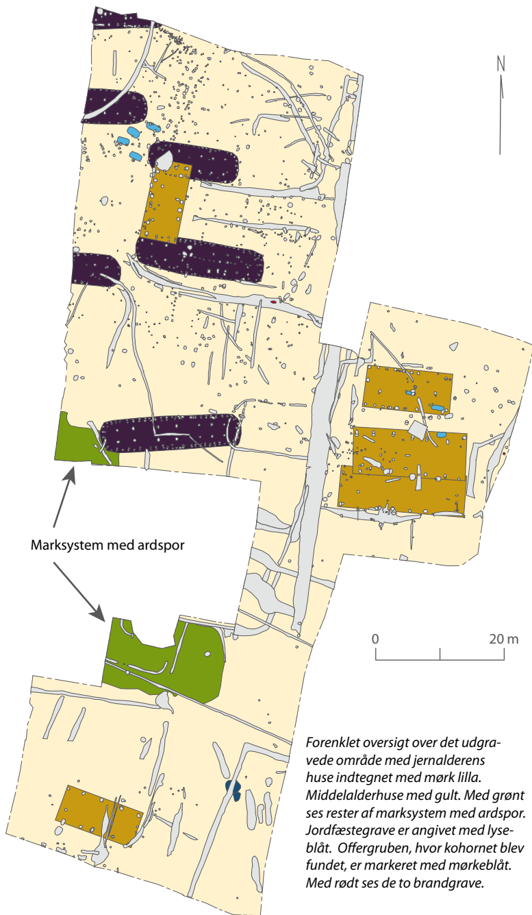
Forenklet oversigt over det udgravede område med jernalderens huse indtegnet med mørk lilla. Middelalderhuse med gult. Med grønt ses rester af marksystem med ardsfor. Jordfæstegrave er angivet med lyseblåt. Offergruben, hvor kohornet blev fundet, er markeret med mørkeblåt. Med rødt ses de to brandgrave.