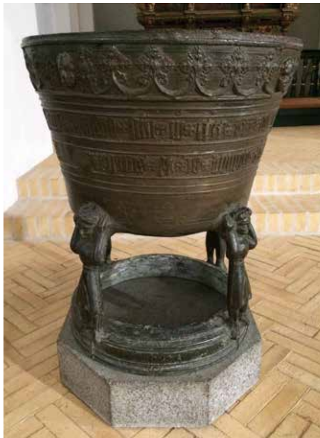
Døbefonten af malm i Sct. Jacobi Kirke i Varde. Der er afstøbt otte pilgrimsmærker på døbefonten.

nogen tvivl om, at man aktivt har valgt at afstøbe pilgrimsmærkerne på den. Afstøbninger af pilgrimsmærker kendes normalt kun fra kirkeklokker. Man har formentlig brugt samme teknik på døbefonten, som har været brugt til at afstøbe pilgrimsmærker på klokkerne, men der er nogen uenighed om, hvilken teknik man har brugt til at overføre pilgrimsmærkerne. Hvis man har lavet en vokskopi af det