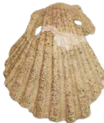
Ibskal med tydelige gennemboringshuler fundet i en grav tilhørende Skt. Olafs Kirke i Aarhus. Den fragmenterede ibsskal fra Velling har formentlig set ud på samme måde i sin fulde form.

Et andet og fragmenteret pilgrimsmærke hører til en populær type, som stammer fra et af de største valfartsmål: Santiago de Compostela i Spanien, der har været besøgt allerede fra 1000-tallet og især var et populært valfartsmål