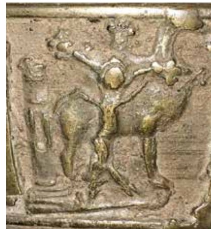
Afstøbning af pilgrimsmærke fra Niedermunster. Mærket viser en korbærende kamel. Et næsten lignende mærke med bevaret indskrift er afstøbt på en tysk kirkeklokke. Indskriften fortæller, hvad mærkets oprindelsessted er.