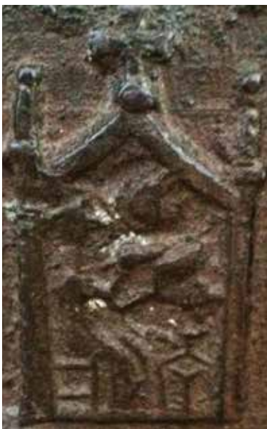
Afstøbning af pilgrimsmærke, der viser Birgitta af Vadstena ved sin skrivepult. Dette mærke har ingen indskrift langs randen, som andre Birgittamærker fra Vadstena, så måske skal mærkets oprindelse tilskrives datterklosteret i Maribo.