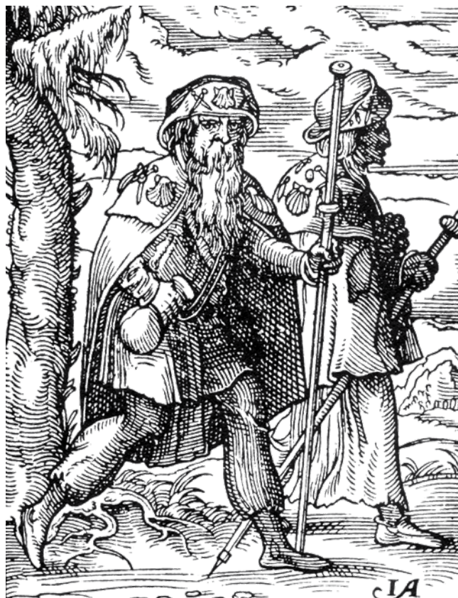
Pilgrimme på vej til Santiago de Compostela. På deres hatte og kapper ses adskillige pilgrimsmærker fra tidligere rejser. Træsnit af Jost Amman.

Pilgrimstraditionen var en central del af troen og det religiøse liv i middelalderen. Man troede på, at man gennem særligt fromme handlinger kunne opnå Guds nåde allerede i det jordiske liv. Den tro trak tusinder af mennesker på lange, hellige rejser. Disse rejsende blev kaldt for pilgrimme, et ord som kommer af det latinske peregrinus og betyder fremmed. Motivationen for at drage ud på en rejse, der ofte har været lang og farefuld, har i høj grad været ønsket om at sikre sin sjæls frelse i efterlivet, men kan også have