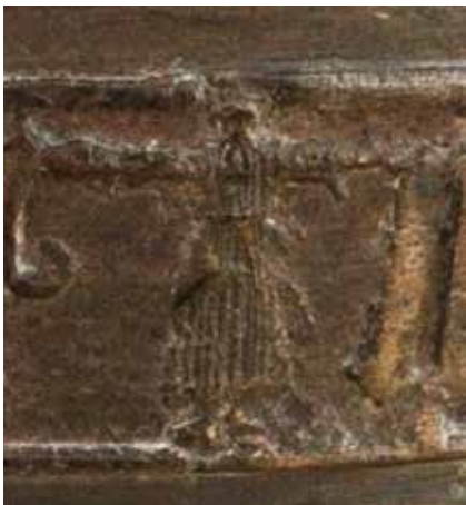
Afstøbning af pilgrimsmærke fra Kliplev, forestillende Skt. Hjælper.