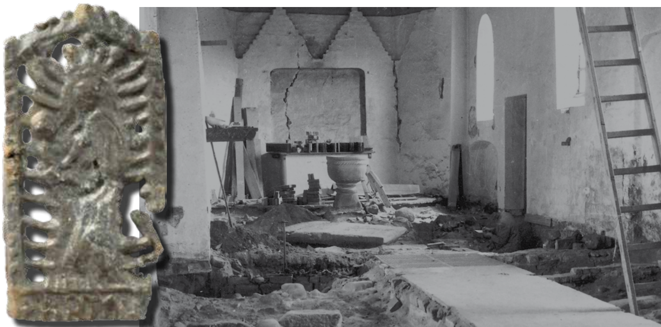
Pilgrimsmærket fundet i Brejning kirke. Mærket stammer fra Karup og viser Jomfru Maria med Jesusbarnet. Foto fra restaureringen af gulvet i Brejning kirke.