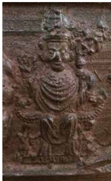
Afstøbning af pilgrimsmærke fra Thann, der viser Skt. Theobald.