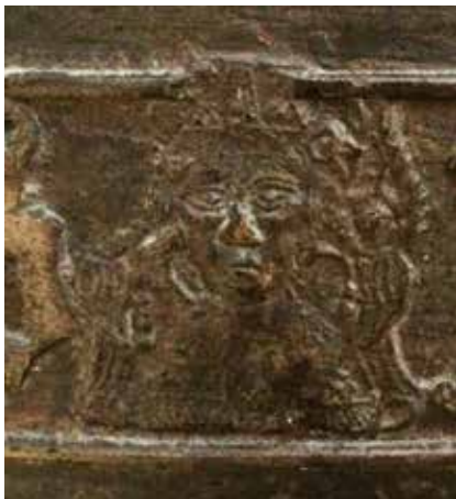
Afstøbning af pilgrimsmærke, der viser Skt. Servatius fra Maastricht. I 1403 fik man i Maastricht et hovedrelikvarium, hvis udformning minder om denne afstøbning. Derfor er mærket nok støbt mellem 1403 og 1437, hvor døbefonten bliver støbt.