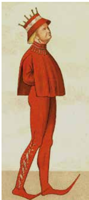
Dette samtidige billede af Christoffer af Bayern har givetvis bidraget til historikerens opfattelse af, at han var en ubetydelig person, som gik mere op i tøjmode end i at regere sine tre riger. Datidens byborgere havde et ganske andet indtryk af en konge, som uden al tvivl var særdeles aktiv på det bypolitiske område. Udsnit af frise i Cabinet des estampes i Paris.

Derudover tog Christoffer også Ringkøbings borgere, deres husstande og tjenestefolk samt deres ejendom i sit "værn, hegn og beskærmelse". Kongen skyldte at skaffe alle fred, men nogen stod han i et særligt forhold til; blandt disse var byerne og deres borgere. Byerne udgjorde særlige retskredse, som havde kongen som umiddelbar lovgiver, mens lovgivning i landet i øvrigt var en langt mere kompliceret proces (landskabslovene gjaldt dog også i byerne i det omfang, disse ikke havde egne bestemmelser, som erstattede den almindelige lovgivning). Båndet mellem konge og byer var på mange måder tættere end tilfældet var i forhold til de fleste af kongens øvrige undersåtter. Men byerne betalte også skatter og afgifter, som generelt var større, jo bedre byerne trivedes, ligesom de bidrog uforholdsmæssigt meget til kongens militærmagt. Så konge og byborgere havde en fælles interesse i byernes