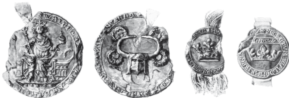
Der kendes tre segl fra Valdemar 3. Her ses for- og bagside af hans imponante rigssegel samt to såkaldte sekreter til mere dagligdags brug. Hvis det, som mest sandsynlighed taler for, var Valdemar 3.s privilegier, Christoffer af Bayern fornyede, har det gamle dokument sikkert været forsynet med et af de to sekreter.

Men hvad er grunden til, at vi ikke kan se det brev, Christoffers skriver kunne se i 1443, og dermed slippe for den foregående diskussion? Så snart et privilegiebrev var bekræftet af en ny konge, var det ikke mere værd end det pergament, det var skrevet på – medmindre det rummede privilegier, som ikke eksplicit blev bekræftet af den næste privilegiegivende konge. Og pergament var et meget dyrt materiale – skabt gennem lange bearbejdningsprocesser af dyreskind, som oftest kalveskind. 19 Det var ganske almindeligt i middelalderen, at uaktuelle pergamentdokumenter blev genbrugt til de remme, som skulle til for at hæfte segl på netop pergamentbreve, ligesom de langt op i tiden blev brugt som fyld i bogbind. Det er for så vidt mere overraskende, at fx Ribe bys arkiv og ganske mange andre bevarede i hvert fald ordlyden af i princippet ligegyldige gamle privilegiebreve – og også mange originaler – helt op til vor tid.