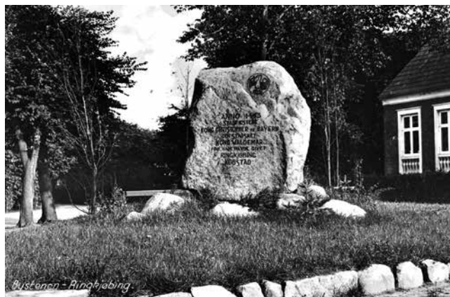
I dag er både den pyntelige forhøjning og jernbanehotellet i baggrunden væk. Men se selv efter ved Østergades udmunding i Nørredige. Bysten er der endnu.

sig over i Ringkøbing, men borgerne i Viborg havde åbenbart haft så meget besvær med at få respekteret denne ret, at de den 11. juni 1442 havde sendt en delegation helt til Lødøse nær nuværende Göteborg for at få udstedt et særskilt privilegiebrev på dette af kongen, mens han forhandlede om bl.a. sin tronbestigelse i Norge. Men også dette indgik i den "pakke", Ringkøbing fik. I øvrigt var det ikke kun Ringkøbing, som fik glæde af Christoffer af Bayerns byret for Viborg. I 1442 blev den med få ændringer indført i Varde, og efter Christoffers død nåede den Kolding (1452), Hjørring (1505), Thisted (1542), Sæby (1525) og endelig Holstebro i 1552. 3