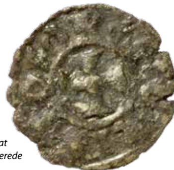
Denne lille undseelige mønt fra Christoffer 1.s regeringstid 1252-59 er den ældste, der er fundet i Ringkøbing. Men om den beviser, at Ringkøbing eksisterede som by allerede da, er et åbent spørgsmål.

behov for støtte. Siden blev det anderledes, som det indirekte fremgår af betænkningen fra 1377. Christoffer af Bayern var nok nødt til at rette sig efter reglerne, da han skyldte rigsrådet megen loyalitet som tak for sin indsættelse som konge til erstatning for hans afsatte morbror, Erik af Pommern. Imidlertid var det et nyt privilegium at få ret til at benytte den for Viborg gældende stadsret. Privilegiebekræftelser og især -udvidelser var altså én af kongemagtens og centraladministrationens næppe ganske uvæsentlige, om end åbenbart svingende, indtægtskilder i middelalderen. 9