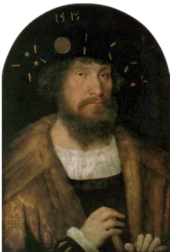
Portræt af Christian 2. (1481-1559). Michiel Sittow: Statens Museum for Kunst.

I laden på Bundsbæk Mølle hænger Christian 2. Fra sin plads kan han se frem i historien. Han kan se henrettelsen af Johann Friedrich Struensee, han kan se love, hans efterfølgere har givet, og så kan han se rakkere. Rakkerpak, natmænd, udstødte, hele laden er fyldt med dem – og med deres historie – men det hele starter med Christian 2.