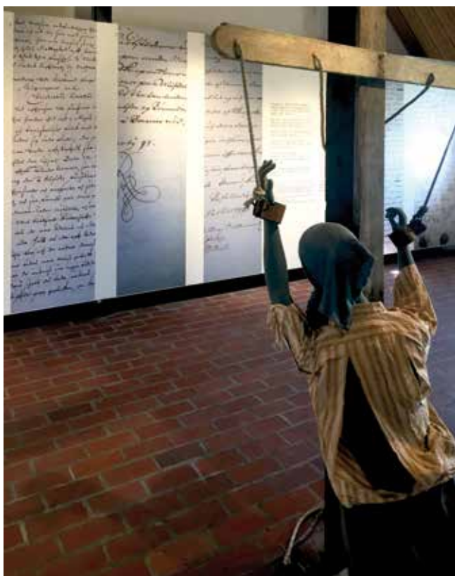
Foto fra udstillingen "Rakkerpak - Æreløse rakkere og udstødte natmandsfolk i Danmark" på Bundsbæk Mølle.

Efterhånden blev rakkeren og natmandens erhverv overflødig, men det at være rakker var stadig noget, man var. Langsomt blev rakkerens børn dog alligevel optaget i det danske samfund, rakkerne uddøde, og i dag skal vi på museum for at møde dem.