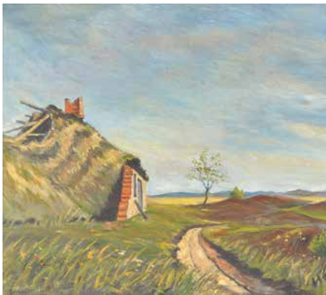
Ruinen af rakkerhuset i Bjørnemosen kort før nedrivning. Maleri af H. Flytkjær.

At rakkerne blev udstødt af samfundet betød også, at de ikke var velkomne i kirken – men kirken afviser jo ikke nogen! Så i flere af landets kirker blev der opsat særlige, ofte dårlige, stole og bænke til rakkerne, så den øvrige menighed ikke skulle sidde ved siden af de udstødte. 8 Dejbjerg Kirke er en af de kirker i Danmark, hvor de såkaldte