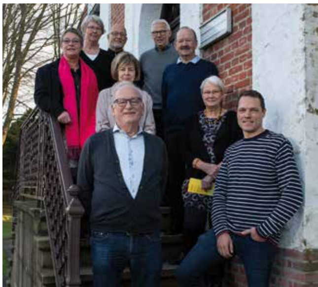
Bestyrelsen i 2017.