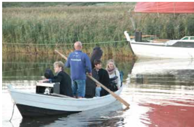
Trio Fjord, instrumenter og lydanlæg sejles over til "Sildebåden".