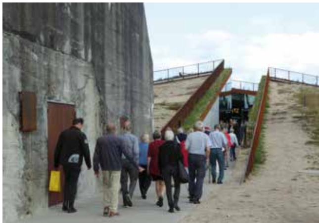
Årets udflugt gik til Tirpitz.

Vi er som museumsvenner meget stolte over disse resultater. Som foreningsrepræsentanter i museernes bestyrelser har vi påtaget os et medansvar for museernes udvikling og investeringer. Det folkelige bagland har dermed været med