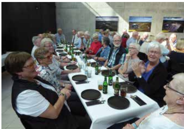
Der blev også spist frokost i Tirpitz inden turen gik videre til Filsø og Oksbøl.