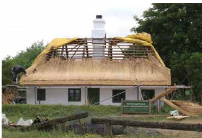
Hattemagerhuset får nyt stråtag.

(historiske) egn ...". I hvert fald vil der i 2018 blive set på mulighederne for et samarbejde med bestyrelserne for de små lokale, selvstændige museer, der er beliggende i vores foreningsområde. Disse steder er vigtige lokaliteter, hvis man skal fortælle hele historien om vores egn.