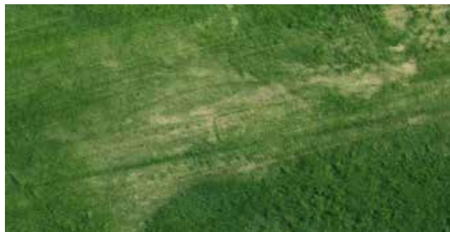
På luftfotoet fra 2009 ses tomten af en gård med to huse, der har været forbundet med et hegn.

Feltet var sat af, alt var klart til udgravningens begyndelse mandag den 2. oktober. Vejrguderne var taget i ed.