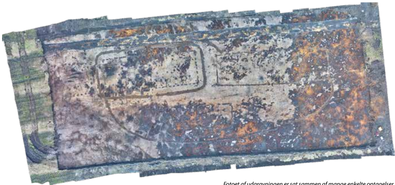
Fotoet af udgravningen er sat sammen af mange enkelte optagelser.

der været en indgang. Overordnet set er de to langhuse således meget lig hinanden. Derimod afviger husene lidt fra hinanden både med hensyn til orientering, længde og vægkonstruktion. Mens hus 1 har næsten helt lige langsider og et vægforløb, der i hovedsagen markeres af tætstillede stolpehuller med markante dobbelte stolpehuller i hjørnerne, er langsiderne i hus 2 mere krumme og væggen forankret i en stort set sammenhængende væggrøft. De to huse har været 15-18 m lange, hvilket gjorde dem væsentligt større end husene i Lyngsmose-fæstningen, hvor det længste måler 13 m. Hus 2 er med sin længde på 18 meter også i sammenligning med hustomter på andre vestjyske bopladser fra keltisk jernalder ud over det normale og nærmer sig denne periodes formodede stormandsgårde, som skiller sig ud med langhuse med en længde på 22 m eller derover. 7