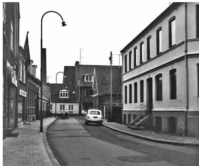
Nørregade 3 til højre i billedet. Ejendommen blev opført i 1879 – ”efter den tids forhold en anseelig ejendom”. For få år siden blev ejendommen revet ned, og der er opført en beboelsejendom på Nørregade 1-3.