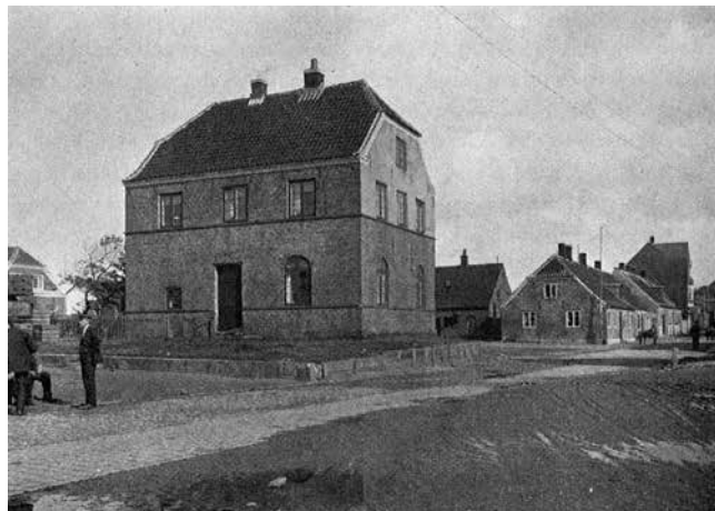
Toldboden ca. 1920.