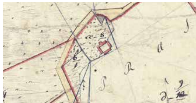
Udsnit af Original 1-kortet over Borris sogn med gården Vester Kjærgaard.