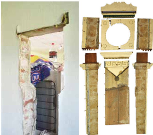
Nu er klokken faldet i slag for det gamle ur. Delene er gemt på Ringkøbing-Skjern Museum, og på Vester Kjærgaard er kun et hul i muren tilbage.