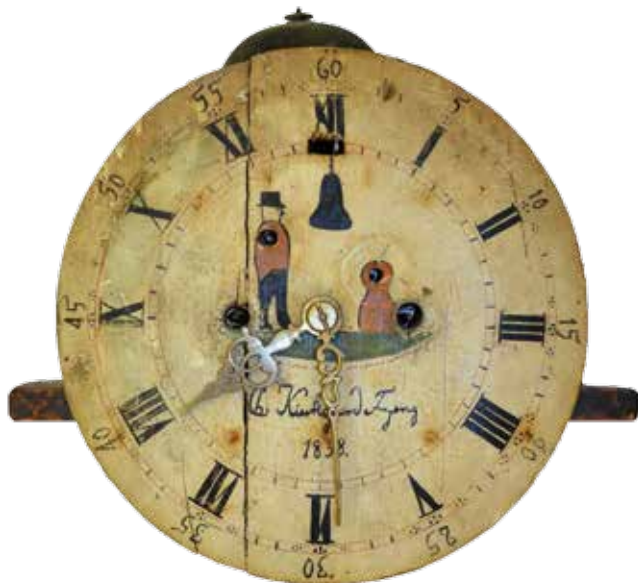
Uret set fra stuen ...