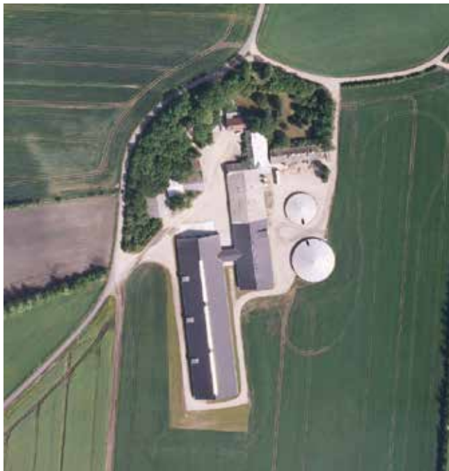
Ortofoto (2008) af Vester Kjærgaard som den ser ud i dag.