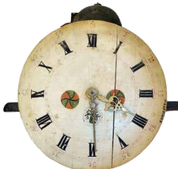
... og fra køkkenet.