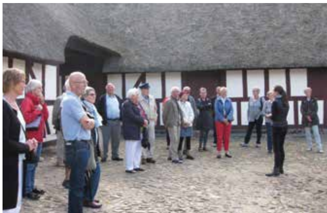
Besøg på Glud Museum.