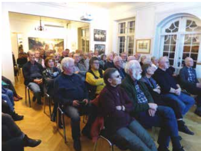
Foredrag på Dommerkontoret.

Ringkøbing Museumsforening oplever fortsat en solid interesse for foreningens arrangementer og ikke mindst de mange tilbud Ringkøbing-Skjern Museum byder på. Foreningens bestyrelse løfter en stor opgave som arrangør af foredrag og udflugter. Dertil kommer alt det praktiske arbejde med at skrive og udbringe programmer og årbøger samt at afvikle arrangementerne. Stole skal stilles op, der skal sælges billetter, bydes velkommen, laves kaffe og ryddes op igen. Der ydes på den måde en betydelig frivillig indsats for museet. Samtidig sker der noget på Dommerkontoret, når museet er lukket. Lyset tændes i et herligt museumsmiljø i det smukke hus tegnet af Ulrik Plesner. Vort ønske om at få forbedret forholdene er blevet imødekommet. Åbningen mellem foredrags-lokalet og det tilstødende rum er blevet udvidet, så der er blevet plads til mange flere gæster. Museumsforeningen har kvitteret herfor ved at ofre 20.000 kr. på en fastmonteret