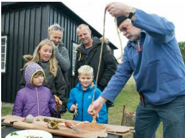
Nogle siger "Adh", andre synes det er spændende, når vi slagter høns til suppedag. Vi skal lige se hvor lang sådan en tarm er.