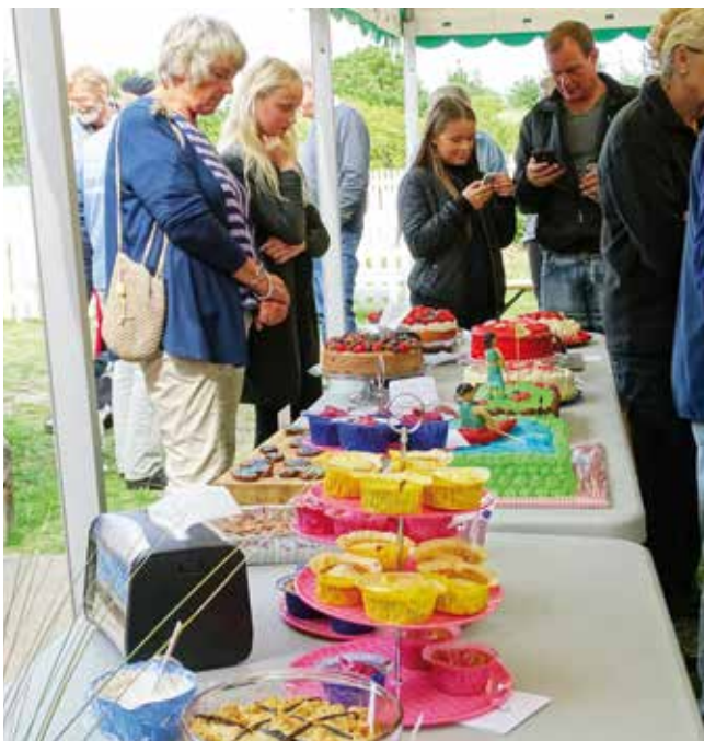
25 kager til kaffebordet ved byfesten for Årets Lokale Landsby.

På Nationalparkdagen i maj var Nymindegab Museum centrum for aktiviteter i det nordvestlige hjørne af Varde