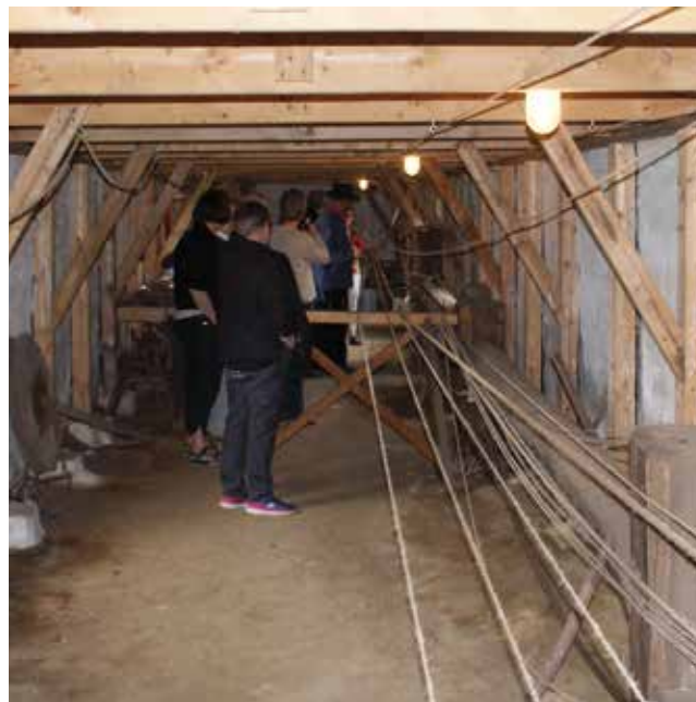
Besøg på Skjern Reberbane.

Et enkelt nyt tiltag blev det dog til i 2016. Selvom museet ligger spredt meget ud i kommunen, er der alligevel en lang række steder af stor lokalhistorisk betydning, som ikke er i museets regi. Det kan være mindesmærker, spændende steder i naturen eller specielle bygninger, som i nogle tilfælde drives som selvstændige museer. En del af disse lokaliteter er beliggende i vores museumsforerings område. Da vi ikke mener, man kan fortælle egnens historie uden disse steder, er vi begyndt at interessere os for dem. Derfor tog museumsforeningens bestyrelse på en udflugt til Hoven, hvor vi først fik en guidet rundtur i Tirsbjerg plantage og omkring I.C. Christensens barndomshjem. Efter at have fået en gennemgang af altertavlen i Hoven kirke sluttede vi med et besøg i Hoven gamle skole, som rummer landsbymuseet og lokalarkivet. Her fik vi naturligvis også en fortælling om Hoven Kvindehøjskole, der var beliggende i nabohuset, som i dag er i privat eje. Vi havde et meget givtigt kaffemøde med medlemmer af landsbymuseets bestyrelse, hvor vi udvekslede tanker om et fremtidigt samarbejde. En spændende dag, som måske kan give anledning til at inddrage landsbymuseet i en fremtidig information om vores egnens historie, og som kan være mål for arrangementer for vores forenings medlemmer, måske under temaet "Kend din egnens historie ...". Der ligger spændende historier og seværdige steder også uden for Ringkøbing-Skjern Museums portefølje.