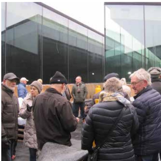
Rundvisning i Tirpitz.

Næstformanden styrede med sikker hånd den 9. maj aften turen til Gram slot, der foregik i egne biler og havde god