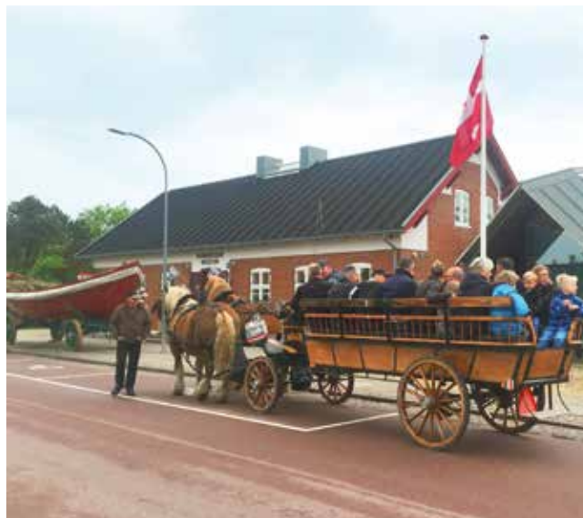
Redningsbåd og hestevogn foran museet til Nationalparkdag i maj.

Formand for Nyminddegab Museumsforening.