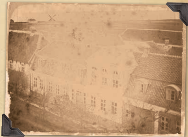
Foto: Formentlig Carl Christian Carlsen eller fotograf Poulsen RIM6214F4

Bemærk hvordan der bag baghusene er åbent land kun brudt af Gammelsogns Mølle.