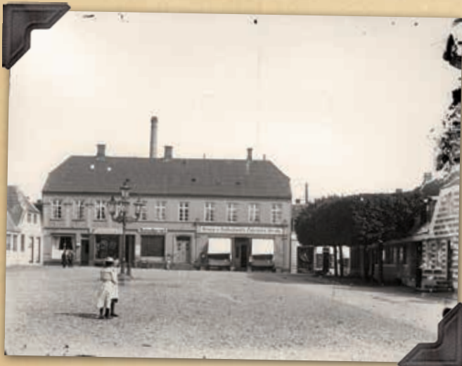
Foto: Formentlig Carl Christian Carlsen eller fotograf Poulsen RIM6214F2

Vi går en generation frem i tid til bedre fotokvalitet og til nye tider. Efter ombygning 1902 er der flere butikker i huset: Ringkøbing Cyklemagasin og Crome & Goldschmidts Fabrikers Udsalg.