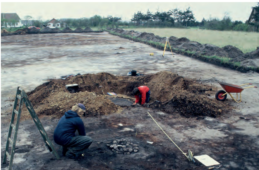
Udgravningen af grave på Lønne Hede i 1995.

i alt 12 undersøgte jordfæstegrave på Lønne Hede, var meget forskellige, og repræsenterer sandsynligvis både høj og lav i det lille jernaldersamfund, der har benyttet gravpladsen.