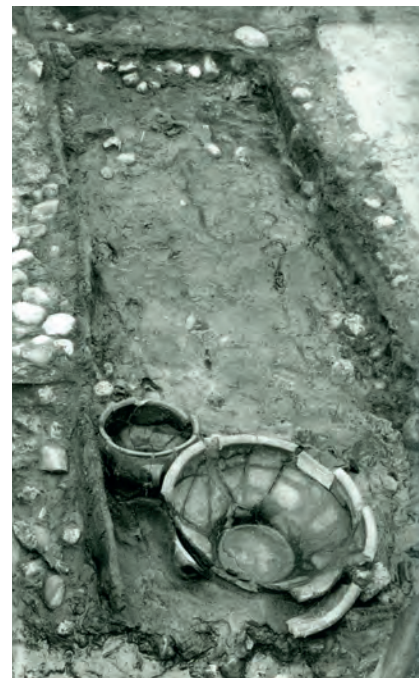
Lønne Hede 1969. Udgravningsfoto.

Det mest opsigtsvækkende ved graven var de bevarede tekstiler, der fandtes som en sammenhængende klump i kistens ene halvdel. I fremdragelsesøjeblikket var tekstilerne tydeligt kulørte, røde, brune og blå. Rekonstruktionen af klædedragten resulterede i et skørt