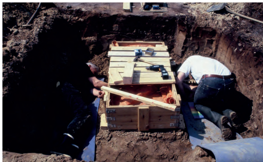
Konservatorerne optager præparater.

Menneskets påklædning kan afspejle køn, alder og status, og der ligger derfor en stor fremtidig forskningsopgave i at forklare, hvordan tekstilerne så ud, hvor har de siddet på kroppen og hvilke dele dragterne bestod af. Med moderne analysemetoder kan man undersøge om uldens farve er naturlig eller indfarvet, hvor på fåret den sad – det er lige før man kan finde ud af, hvor fåret har græsset og hvad det har spist. Museet håber meget på at indlede et forskningssamarbejde med CTR (Center for Textile Research) og hermed få fravristet Lønne Hede-fundet alle dets hemmeligheder.