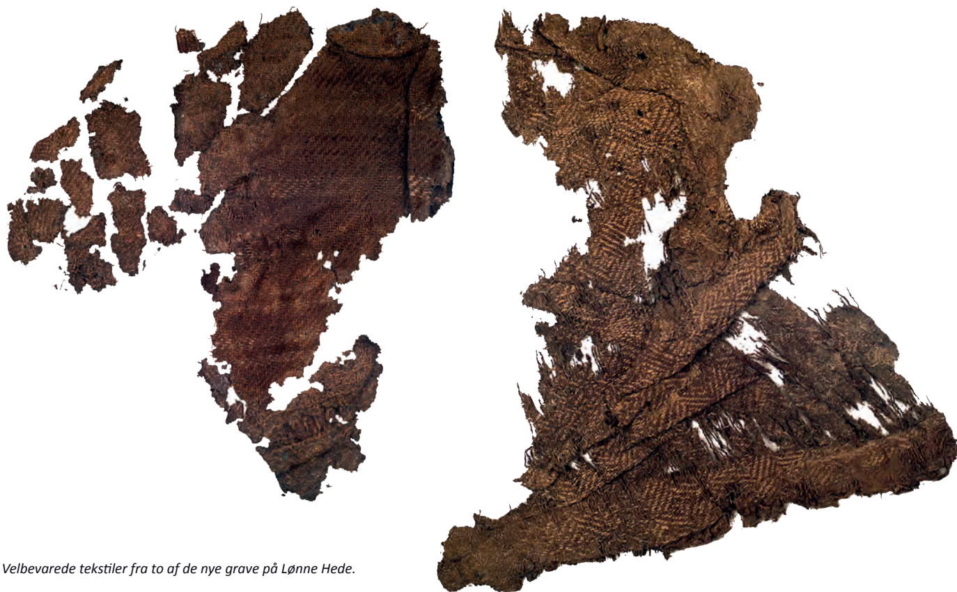
Velbevarede tekstiler fra to af de nye grave på Lønne Hede.

spiste hun? Hvordan fik hun tøj på kroppen? Vi ved faktisk en hel del, for vi har gravet rigtig mange jernalderhuse fra ældre romersk jernalder (0-200 e. Kr.). Derfra ved vi, at de var indrettet med stald i øst og beboelse i vest og at man har holdt både køer, grise og får. I forbindelse med husene finder vi ofte skubbekværne, hvor man har gruttet korn og et andet hyppigt