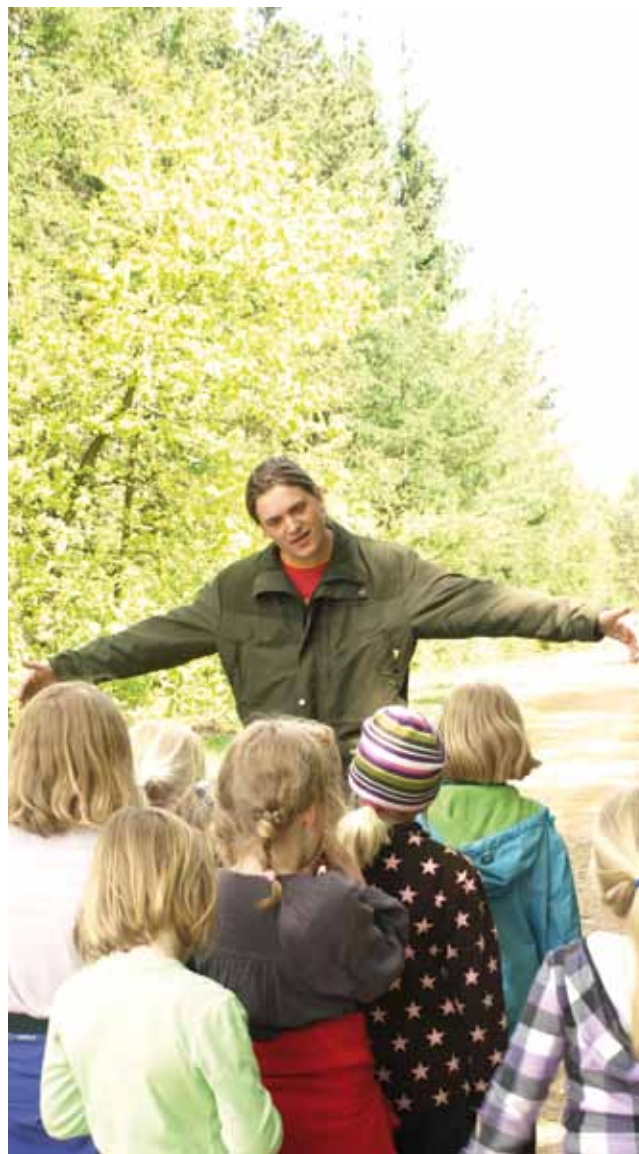
Ringkøbing-Skjern Museums Kulturarvspædagogik og sammenhæng mellem natur- og kulturformidling ligger i tråd med skolereformen.

Hvorfor skal museer overhovedet bekymre sig om at have læringstilbud til institutioner, skoler og uddannelser? Er kræfterne ikke bedre brugt på at lave gode udstillinger – så kan skolerne jo selv opsøge dem, og historielærerne undervise børnene i områdets historie? Når vi på begge