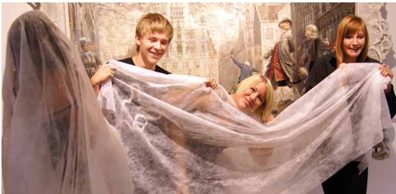
Med den ny skolereform skal skolerne bruge områdets kulturliv i læringsarbejdet.

entreprenørskab. Skolerne skal være "en åben skole" i forhold til institutioner, virksomheder og kulturmiljø i deres lokalområde, og museerne er en af de samarbejdspartnere, der kan hjælpe dem til at blive det i praksis.