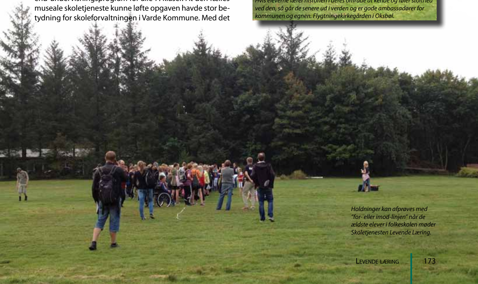
Holdninger kan afprøves med "for- eller imod-linjen" når de ældste elever i folkeskolen møder Skoletjenesten Levende Læring.