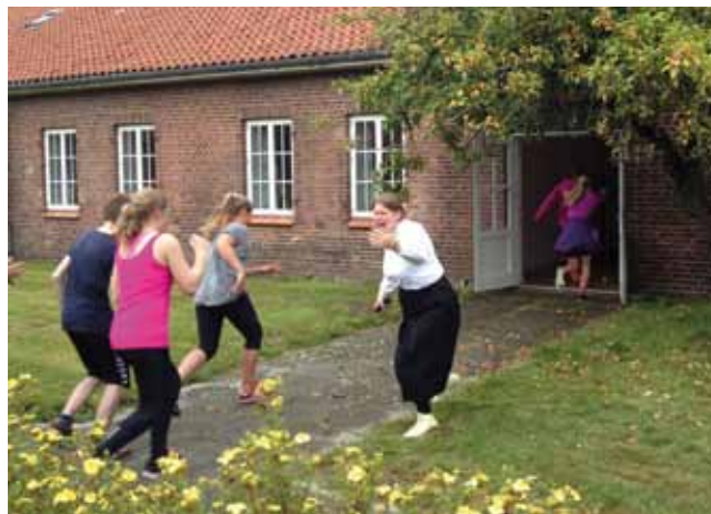
Levende formidling er afgørende for at fange elevernes opmærksomhed, uanset klassetrin. F for Flygtning i Oksbøl.

historiske viden generelt op på. Den har også gjort eleverne reflekterende i forhold til flygtningeproblematikker. Det mærkede museet blandt andet efter et fælles projekt med Ringkøbing-Skjern Museum i august 2014, hvor Varde Kommunes samlede 7. klasser stiftede bekendtskab med flygtningehistorier og -følelser i projektet F for Flygtning. Måned efter projektet var afsluttet, inviterede elevrådet på Blaavandshuk Skole i Oksbøl nyankomne, syriske flygtninge, der var blevet indlogeret i Nymindegab, på en dag med kaffe og leg i deres SFO. Eleverne tilkendegav selv, at de havde lyst til at hjælpe, fordi de havde været med i F for Flygtning.