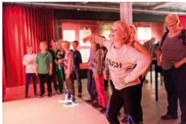
På Kulturmuseet Spinderihallerne i Vejle kan man danse som en del af historien om danserestauranten Røde Mølle.

Mange skoler tilrettelægger efterhånden en del af undervisningen som "Udeskole", hvor en fast del af skemaet foregår udendørs. De skoler, der har arbejdet længst med den type undervisning er imidlertid enige om, at "Udeskole" er meget mere end undervisning i naturen. Undervisning i andre omgivelser end klasselokalet giver i alle tilfælde samme effekt, som man ønsker med udeskole, nemlig at der kan bruges andre læringsmetoder, samt at eleverne gennem bevægelse får en bedre indlæring af stoffet. Undervisning på et museum eller i et kulturmiljø ude i