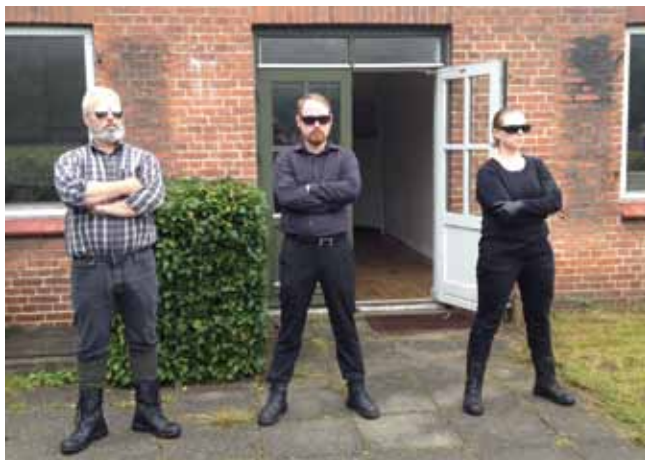
Professionel museumsundervisning kan rykke eleverne fagligt og personligt. Her i mødet med "Administrationen" i forløbet F for Flygtning.

Ved at kunne tilbyde professionel museumsundervisning i vores fokusområder kan vi styrke (lokal)befolkningens kendskab til stedernes betydning. Museet for Varde By og Omegn har gennem seks år gennemført projekter for kommunens 8. klasser i forhold til flygtningehistorien som en del af Kulturel Rygsæk i Varde Kommune. På den måde har alle unge mennesker i Varde Kommune i dag kendskab til, at Danmarks største flygtningelejr efter krigen lå i Oksbøl – noget, der bestemt ikke var tilfældet for syv år siden. Den viden har de ikke kun brugt til at hænge deres