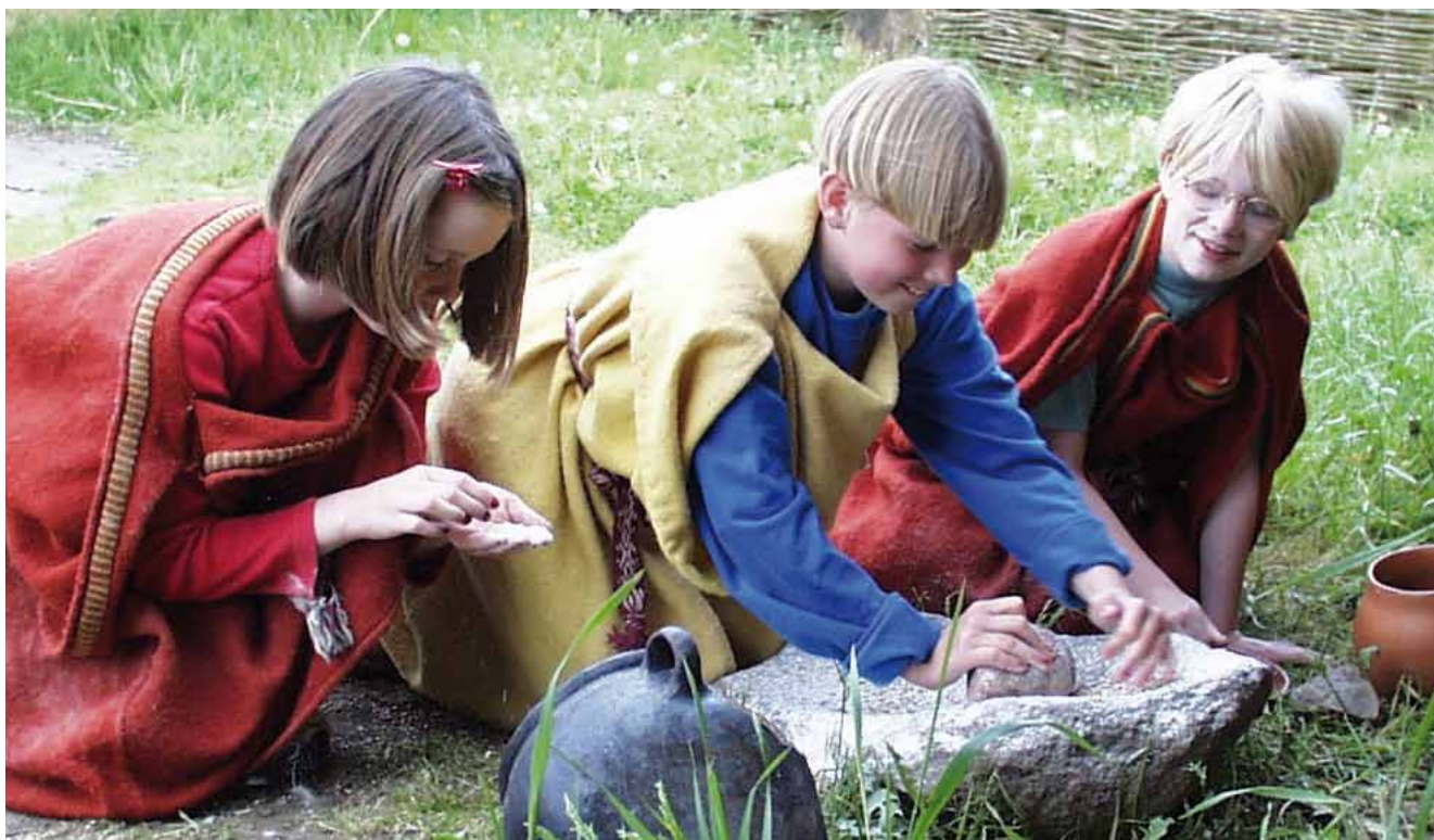
"Hands on" oplevelse giver eleverne en forståelse for Innovation, når de bruger skubbekværnen på Dejbjerg Jernalder.

Forfatterne kan kontaktes på mbj@vardemuseum.dk , pll@levendehistorie.dk samt ah@vardemuseum.dk