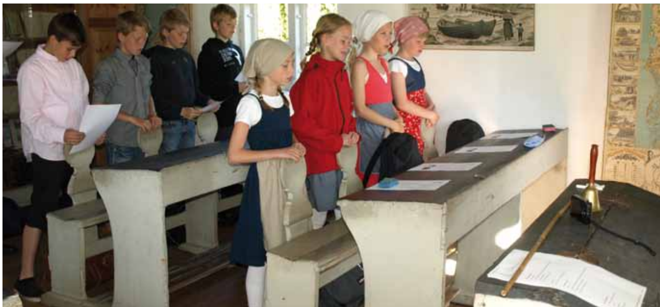
"Tidsrejsen" er en metode at føre eleverne mentalt ind i historien på. Den fungerer godt i museumsregi.

Fremover vil formidlerne på de to museer mødes et par gange årligt til temadage, hvor vi kan uddanne hinanden i