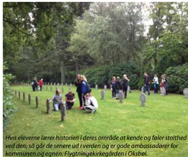
Hvis eleverne lærer historien i deres område at kende og føler stolthed ved den, så går de senere ud i verden og er gode ambassadører for kommunen og egnen. Flygtningekirkegården i Oksbøl.

F for Flygtning er desuden et rigtig godt eksempel på, at vi som museumsinstitutioner kan fremtræde mere professionelt overfor kommunerne i kraft af samarbejdet. F for Flygtning var en del af et kommunalt tilrettelagt weekend-undervisningsprogram for alle 7. klasser. At den fælles museale skoletjeneste kunne løfte opgaven havde stor betydning for skoleforvaltningen i Varde Kommune. Med det