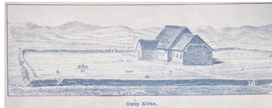
Denne lille tegning i Vardemuseernes samling viser tydeligt den tilsandede kirkegård. Få gravsteder er synlige, og sandflugten har dækket kirkegården.