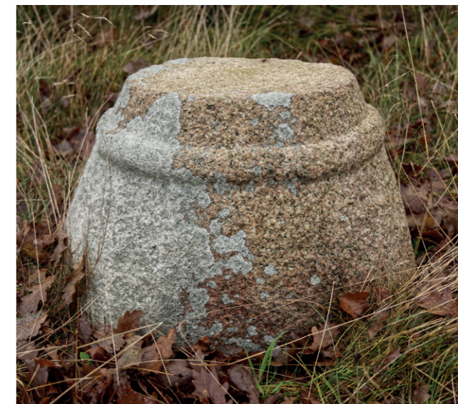
Foden, eller basen, fra den første, romanske kirke står i dag på kirkegården ved Oksby Kirke umiddelbart øst for koret.

Altertavlen beskriver han som værende "I en styg Indfatning fra forrige Aarhundrede..." På forsiden af triumfmuren, den mur, der adskiller skib fra kor, beskriver Helms 12 figurer, udgjort af 11 apostle og Gud Fader. Dem identificerer han som stammende fra sidefløjene på en middelalderlig altertavle. I den stygt indfattede altertavle beskrives en middelalderlig skulptur af Gud Fader og to engle, som Helms mener er dårligt udførte og værdiløse. Ved siden af Gud Fader en Mariafigur med Jesusbarnet, som også får med høvlen: "– tynd og langstrakt, aldeles uden Proportion og uden Interesse." På den anden side