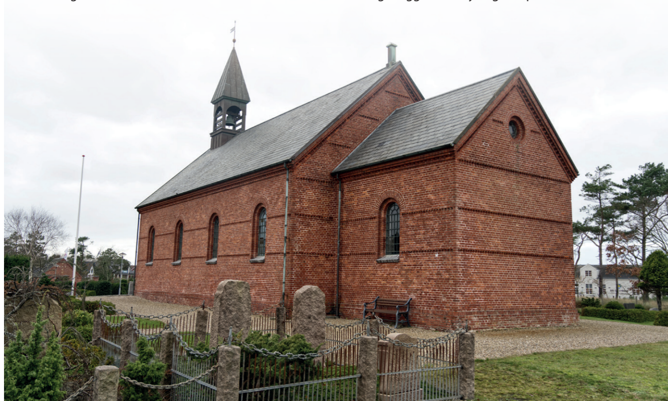
Den nuværende Oksby Kirke er altså nummer tre i rækken af kirker i Oksby Sogn. Dens forgænger, den stråttækte kirke, lå på den gamle kirkegård og blev nedbrudt i 1891. Den havde også en forgænger, som vi kun kender omtalt i en kilde fra 1600-tallet, der fortæller, at den lå syd for den stråttækte kirke. Med i rækken skal egentlig tælles Mosevraa Kirke, som blev en del af forhandlingerne om, hvor den nye kirke skulle bygges i 1891.

Som lovet i indledningen afsluttes artiklen med et par bemærkninger om det omdiskuterede S. Enders Kapel, som også ligger i Oksby Sogn. Kapelstedet kendes endnu