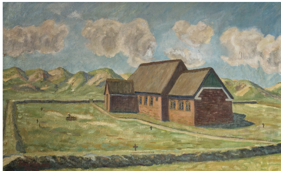
På et nyere maleri, ganske tydeligt inspireret af tegningen fig. 2, er stråtaget tydeligt. Maleri i Oksby Kirke.

den dansk-tyske grænse ved vestkysten, er romansk og har stadig stråtag. Teglsten og kunsten at brænde ler til tegl blev først for alvor udbredt over landet i 1200-tallet, og mange af vores granitkirker er ældre. Den fremherskende opfattelse har været, at de var behængt med bly, men bly var en dyr, eksklusiv importvare. Ofte er tagværkerne over kirkerne fra ældre middelalder udskiftet, og måske er årsagen, at tagværkerne skulle forstærkes, fordi de fleste var dimensioneret til at bære et stråtag fra begyndelsen? I ældre middelalder og i den stråtækte kirkes samtid var kirker med stråtag måske slet ikke så sjældne? Det stråtag, som kirken nu er berømt for, endte med at blive årsagen til, at kirken blev nedbrudt. I 1861 blev en