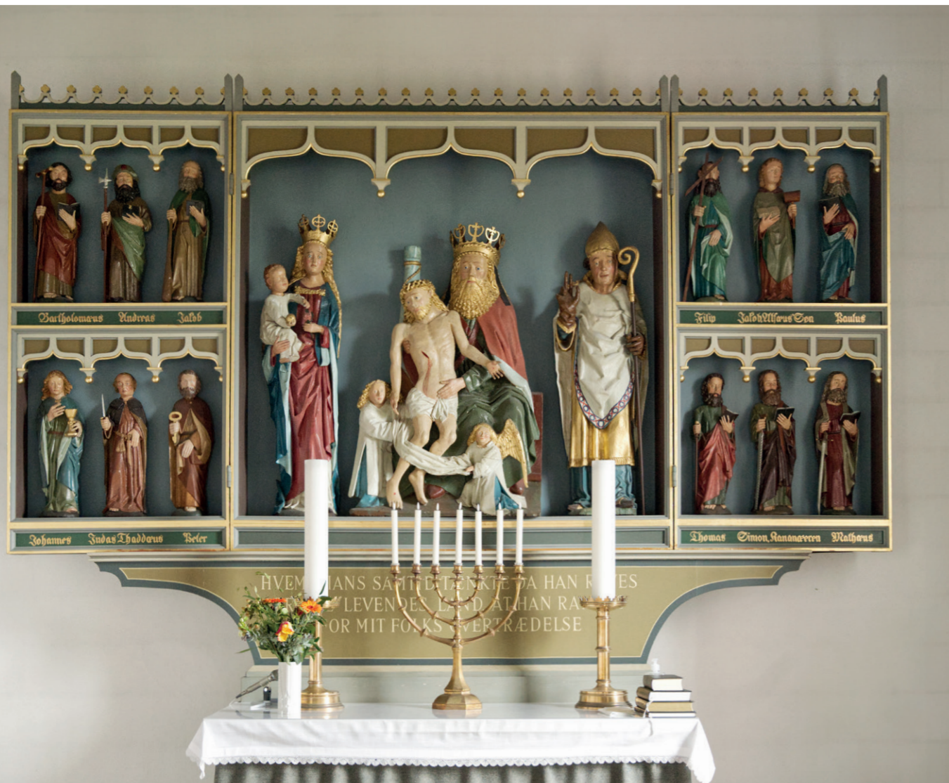
I den nuværende altertavle i Oksby Kirke indgår en del af figurerne fra den senmiddelalderlige altertavle. Centralt i den nuværende altertavle ses Gud Fader, flankeret af Maria med Jesusbarnet til venstre, til højre en biskop. Gud Fader understøttes af to engle, som også Helms kommenterede, naturligvis - fristes man næsten til at sige, med vanlig syrlighed: "Udførelsen er daarlige..."

dens inventar kasseret eller det endte i privateje. En del endte til sidst i Vardemuseernes samling. Vardemuseerne (dengang Museet for Varde By og Omegn) leverede en del af de senmiddelalderlige helgenfigurer tilbage til kirken i Oksby i 1936, hvor de indgik i den nye altertavle (den nuværende). De figurer, der nu indgår i den nye altertavle, undergik desværre restaureringer, der ikke blev udført af professionelle konservatorer. 10