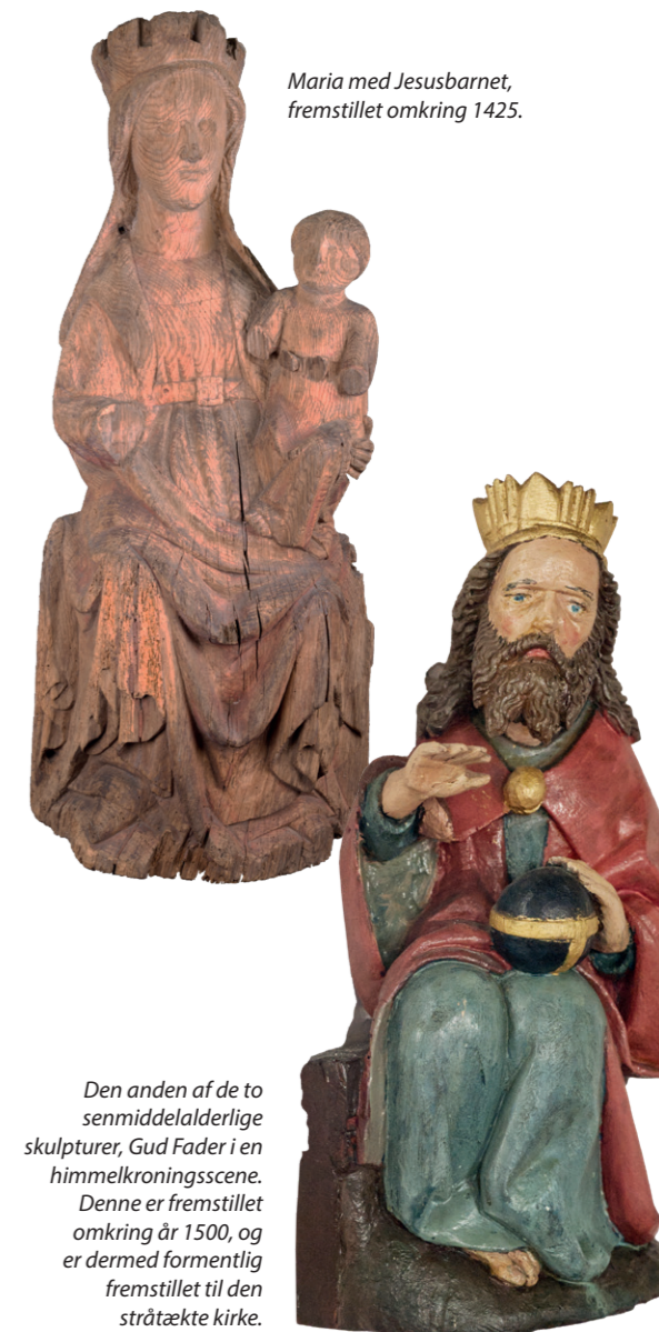
Maria med Jesusbarnet, fremstillet omkring 1425.

Den stråtækte kirke fra omkring 1500 har haft to forskellige altertavler. De figurer, der nu står i Oksby Kirkes altertavle, har formentlig haft omtrent samme plads i den stråtækte kirkes ældste altertavle. Dens opbygning med et centralt felt og to sidefløje var den samme, som den nuværende. I museets samling findes stykker af en stavværksbaldakin af træ, der har indgået i sidefløjene, hængende ned fra fløjenes overkant. Fra den ene fløj er hele baldakinen bevaret. Den er oprindeligt fremstillet i to stykker. Stykkerne er udformet med i alt 16, fint udskårne