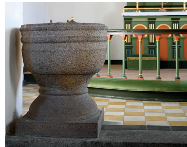
Den middelalderlige døbefonts kumme står i dag i Mosevraa Kirke.

af bindingsværk, men desværre undlader Uldall at datere bygningen. 4