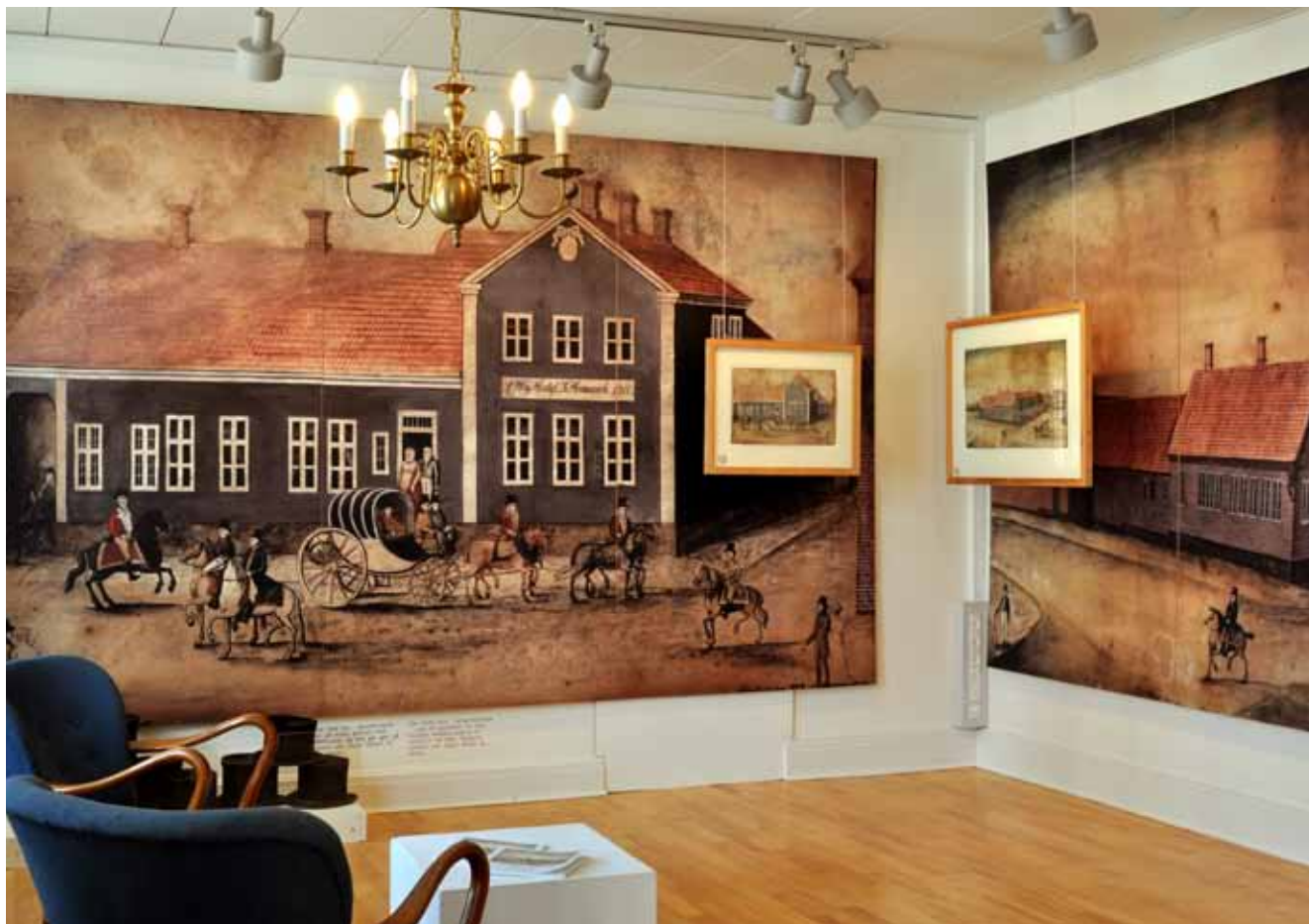
Fra den nye købstadsudstilling på Dommerkontoret.

Chalotte C.K. Mehlsen (foto) & Christian Ringskou (tekst)