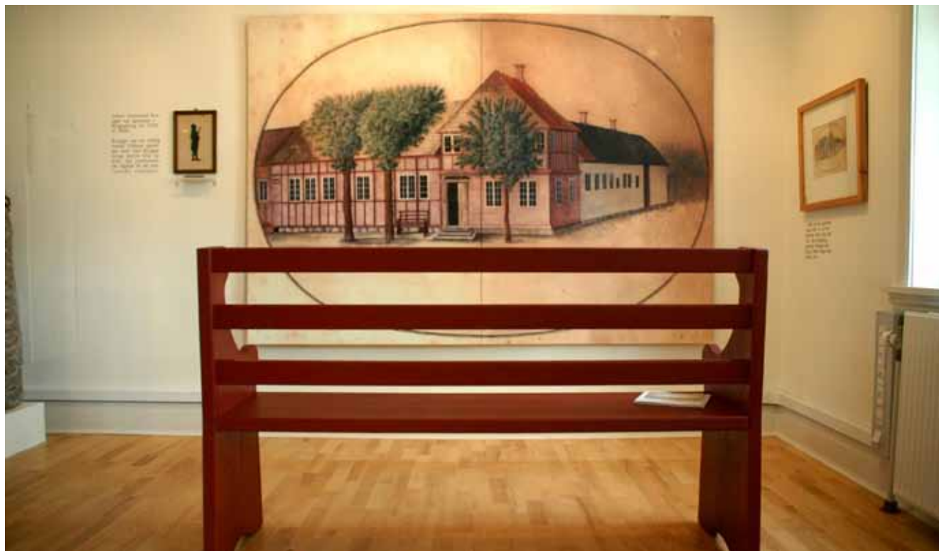
Fra den nye købstadsudstilling på Dommerkontoret.

Ringkøbing er en af Vestjyllands få gamle købstæder. Gadeplanen går mindst tilbage til 1400-tallet, og udover den senmiddelalderlige kirke og Hotel Ringkøbing med 1600-talsbindingsværket er en del huse fra 1800-tallets begyndelse bevaret. Men når man dykker ned i Ringkøbing-Skjern Museums fine samling af Ringkøbing-prospekter, malet af Jesper Kierkegaard i perioden 1808-1847, indser man, at nok ville den, der var stedkendt for 200 år siden, kunne finde rundt, men genkende meget ville han ikke.