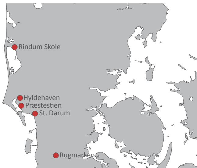
Udbredelseskort over rækkellandsbyer med lighedspunkter til Rindum Ny Skole.

Selvom det er usikkert, hvem der kontrollerede landsbyen og dens udvikling, er det dog sikkert, at den i høj grad blev kontrolleret, hvilket i sig selv siger noget om samfundsstrukturen i den ældre germanske jernalder. Størstedelen af de samtidige landsbyer giver et langt mere dynamisk og levende udtryk, som for eksempel den samtidige landsby ved Nørre Snede. 4 En af de helt store diskussioner indenfor arkæologien har siden 1960'erne været, i hvor høj grad jernalderlandsbyerne har været underlagt overordnede retningslinjer for, hvor, hvornår og under hvilke omstændigheder, man måtte anlægge en ny gård. Dermed også, hvor kontrollerede landsbyerne har været. Hertil bidrager den velorganiserede rækkellandsby ved Rindum med væsentligt diskussionsmateriale. Især er dens placering nær den omfattende samtidige bebyggelse ved Mejlby interessant, idet de to bebyggelser udtrykker to vidt forskellige måder at organisere sig i et landsbyfællesskab på, selvom de kun ligger få hundreder meter fra hinanden.