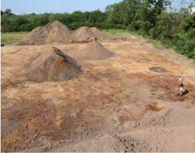
Det nordligste treskibede langhus under indmåling med GPS. Anlæggene, der udgør huset, er markeret med hvide sedler. Huset ligger på tværs i billedet. To jordbunker ligger inde på gårdspladsen, hvor der også på et tidspunkt anlægges en brønd, der ses som en mørkt, rund plet.