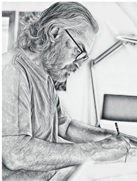
Till tegner tidslinjen.

bronzealderen," kan man fristes til at spørge "hvor?!" Det er ikke til at se, hvis man ikke lige ved det, da huset ikke består i fysisk form. Der er kun "skygger" tilbage. Heldigvis husker undergrunden alle huller og al aktivitet, som fortidens mennesker har skabt. Så når arkæologen stolt peger på et "hus", er det i virkeligheden de huller, husets træstolper har stået i. Eller det kan være selve aftrykket fra stolperne.