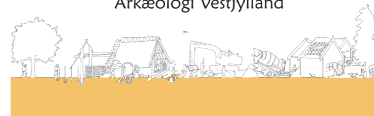
Fra forhistorisk byggeri til arkæologens arbejde. Illustrationen er placeret på vinduesklappen på skurvognens bagside.