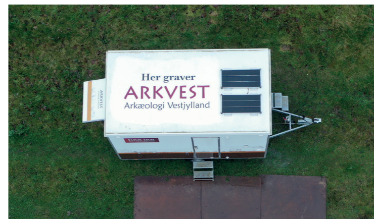
Arkæologerne bruger drone på udgravningerne. Derfor også en hilsen på taget.