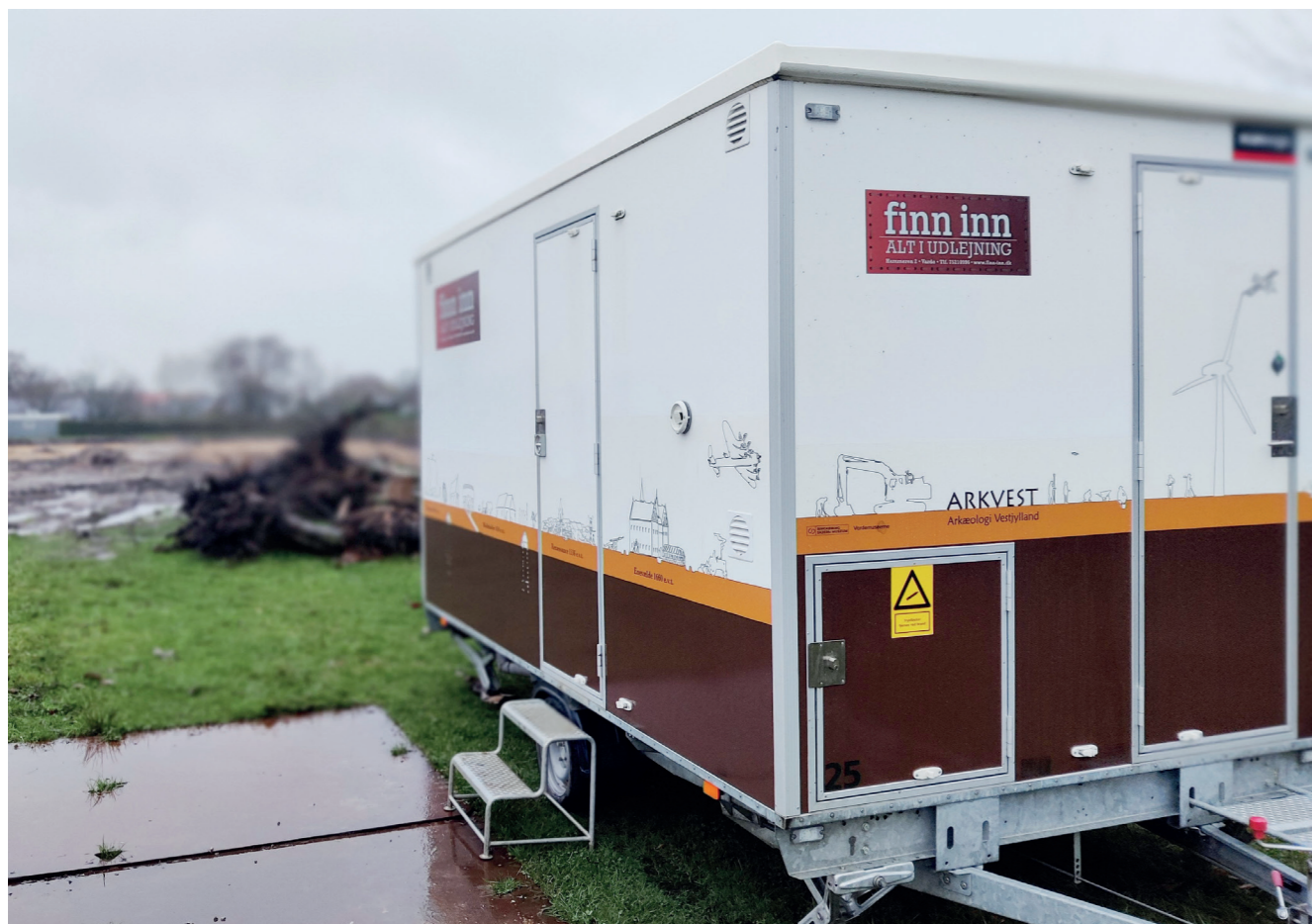
Skurvognen med det nye design parkeret ved udgravning i Nørre Nebel.

Arkæologerne i Arkæologi Vestjylland (ArkVest) – Ringkøbing Fjord Museer og Vardemuseernes fælles arkæologiske enhed - har længe ønsket at pryde vores skurvogn med en tidslinje. Nu er det sket!