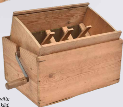
Hjemmelavet kornvifte til sortering af klid.

Kaffe blev et af de mest savnede hverdagsprodukter under krigen. Ringkøbing-Skjern Museums samling rummer flere pakker kaffeerstatning, men vi har også ægte kaffe fra den tid – i en amerikansk kaffedåse. Dåsen indeholder "2 pund Blended Roasted Vacuum packed Coffee". Den blev sendt til et dansk ægtepar fra nogle amerikanske venner i 1945. Den har sikkert vakt stor glæde – eller har den? Datidens kaffetørstende situation in mente er det utroligt, at den ikke er åbnet – den står stadig plomberet med kaffen i.