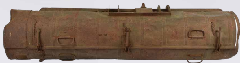
Nedkastningscontainer med rum til våben og sprængstoffer, opsamlet af modstandsbevægelsen efter nedkastning fra engelske fly.