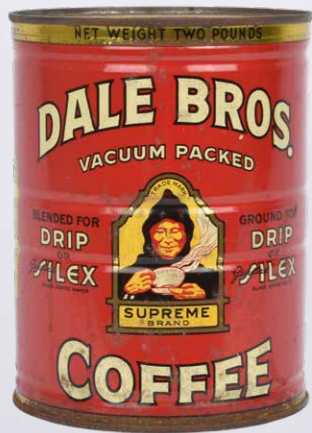
Den uåbnede kaffedåse kaffe fra USA.