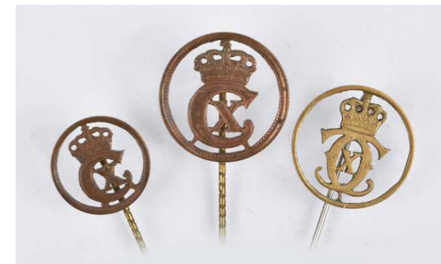
Tre eksemplarer på mønter omlavet til kongemærker.

Det blev fem lange år, der tærede på den danske befolkning. Der var knaphed på meget, især på luksusvarer, som