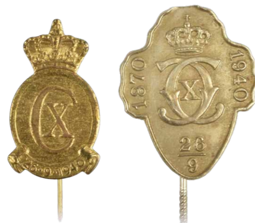
Udgaver af kongemærket, også kaldet kongenål, som blev lavet i anledning af kongens 70-års fødselsdag.

Året inden blev det besluttet at lave et kongemærke i anledning af kongens forestående 70-års fødselsdag d. 26. september 1940. Det oprindelige lille gyldne mærke på nål blev tegnet af Poul Sæbye og blev solgt for 25 øre stykket til fordel for "Christian den Tiendes Fond". Over 1,5 millioner eksemplarer blev der solgt af dette lille mærke på bare 14 dage i september 1940.