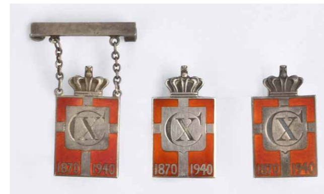
Tre eksemplarer på kongeemblemet – fra venstre er det damemodellen, herremodellen og universalmodellen.

Inspireret af tankerne bag kongemærket fik firmaet Georg Jensens Sølvmedie i foråret 1940 kongens tilladelse til at producere det mere kendte konge-emblem, som blev lavet i både en sølv- og guldversion med rød emalje udført med kongens monogram og årstallet 1870-1940.