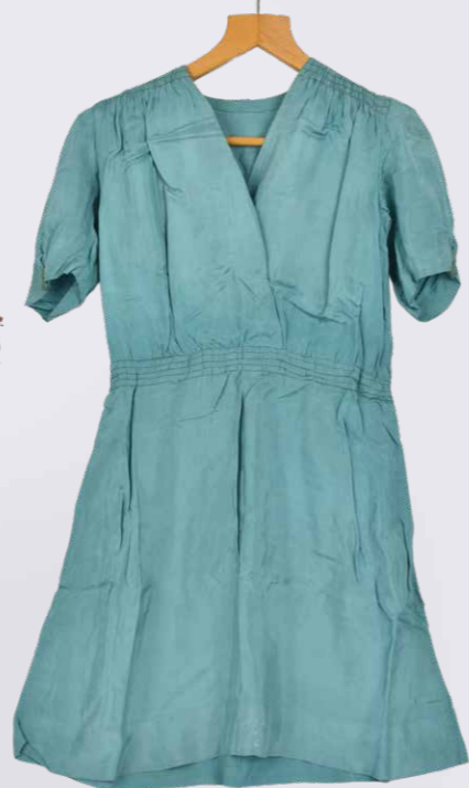
Den turkise og skinnende kjole af faldskærmsstof.