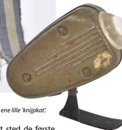
Den ene lille 'knijpkat'.

og norske fanger hjem. Aktionerne fandt sted de første måneder i 1945. Historien fortæller, at kriminaloverbetjentens søn ikke vidste, faderen havde hjembragt ærmet, før han så den i udstillingen på Ringkøbing Museum i 1995.