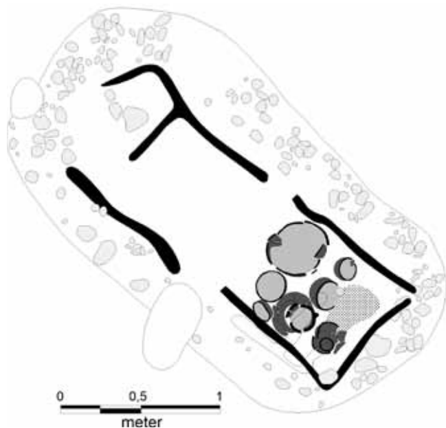
Grav A612. Gravkar i østende af plankekiste. De to stiplede områder angiver at her blev optaget metalgenstande i præparater. Kun sten i overfladeniveau er her gengivet.

Med undtagelse af grav A606 fra yngre romertid var alle lerkar hensat i gravenes østlige ende, indenfor plankekisten.