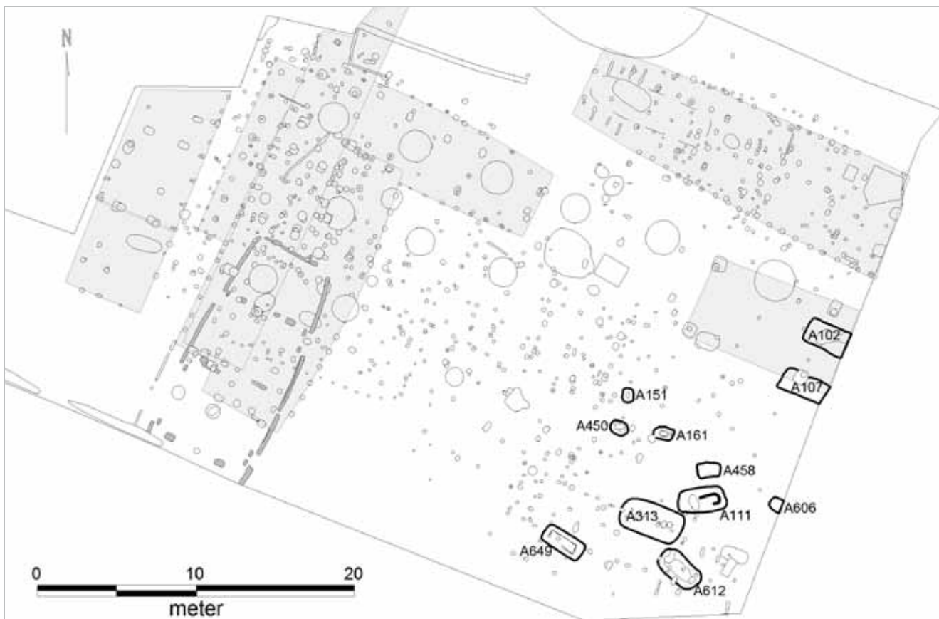
Plan over udgravningsfeltet. Grave er markeret med fedt optrukne linjer.

lidt større grav, A458, som en mulig barnegrav. Den sidste grav, A606, havde en mere normal størrelse og sammen med de seks store grave formodes det, at de gravlagte var enten voksne eller teenagere. Der blev ikke fundet tegn på, at der skulle have været mere end ét individ begravet i hver grav.