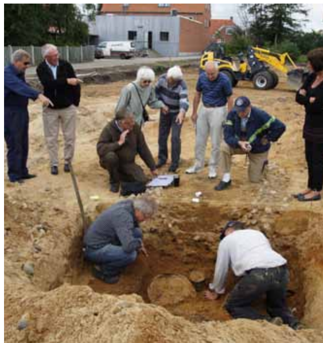
Grav A313 udgraves under stor lokal bevågenhed.

De stod tæt sammen og i ét tilfælde, i grav A111, var et fad lagt omvendt ovenpå tre lerkar. I grav A102 lå en skål indeni et fad og i samme grav havde lerkarrene stået stablet ovenpå hinanden. I takt med at kisten er sunket sammen er lerkarrene så væltet rundt og er blevet knust.