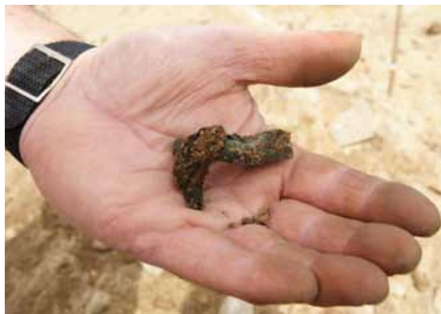
Velbevaret fibula af Almgrens type 7 fra "røverhullet" i grav A107.

Som nævnt ovenfor indeholdt de tre barnegrave ingen gravgaver. I grav A450 blev der dog fundet et stykke uidentificeret metal i gravfylden, som muligvis kunne stamme fra kisten.