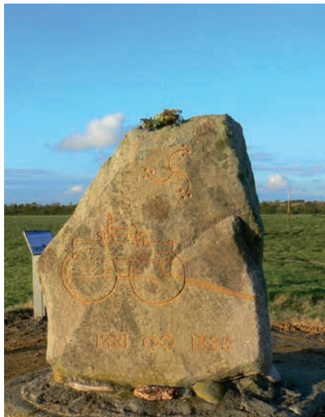
Mindestenen ved fundstedet har fået farverne i sit relief genopfrisket. I baggrunden ses en af de to nye, symbolske vognstænger, der står hvor de to vogne faktisk blev udgravet.

Når vi i dag står på fundstedet og andre steder i dette store landskab, står vi på den bund, hvor tørvedannelsen begyndte engang i fortiden. Vognene blev lagt ned inde ved den sydøstlige ende af dette store moseområde.