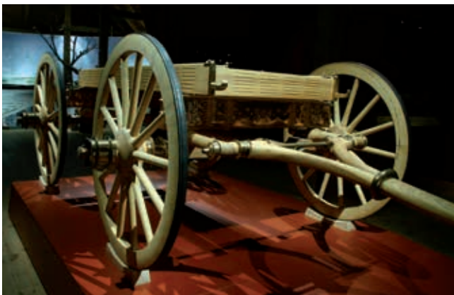
Vognofring rekonstrueret – og vogn destrueret. Scene i forbindelse med etablering af vognudstillingen i Dejbjerg Jernalder.

Mosen mellem Dejbjerg og fjorden har i øvrigt været offersted siden bondestenalderen. Det viser fund af flintøkser, flintdolke, bronzeøkser og jernalderlerkar. Fundene er nu blevet kortlagt i forbindelse med den nye formidling af Dejbjergvognene.