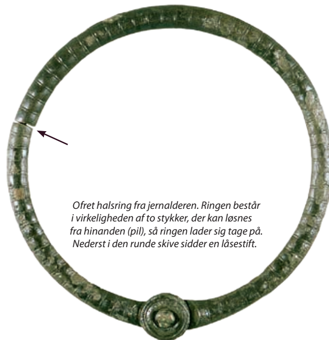
Ofret halsring fra jernalderen. Ringen består i virkeligheden af to stykker, der kan løsnes fra hinanden (pil), så ringen lader sig tage på. Nederst i den runde skive sidder en låsestift.