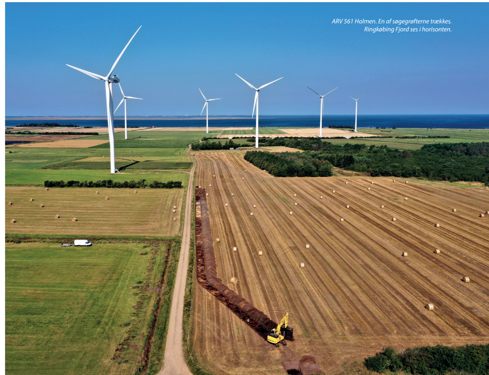
ARV 561 Holmen. En af søgegrøfterne trækkes. Ringkøbing Fjord ses i horisonten.