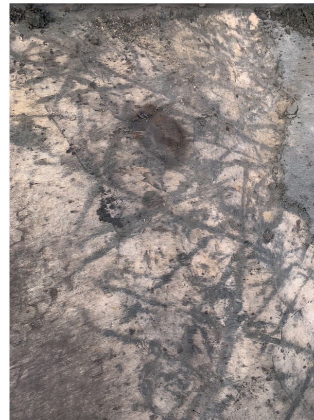
ARV 549 Ormstoftvej, Ringkøbing. De mørke striber i det lyse fygeseand er spor efter pløjning med ard. Ardspor er langt fra sjældne i udgravninger, men det er altid fascinerende at stå ved siden af, hvad der blot var en rille i jorden for 2000 år siden - det kunne næsten lige så godt have været et fodspor.