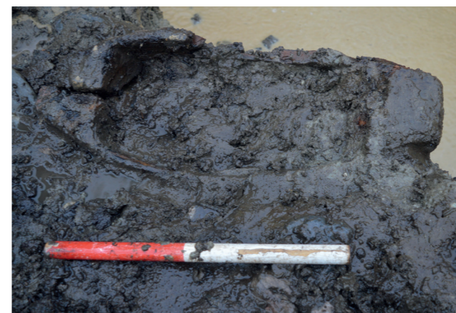
ARV 424, Rådhusgrunden i Nr. Nebel. I en brønd fremkom dette velbevarede og næsten intakte trætrug. Truget er ikke større, end det med lethed kan bæres i armene (målestok = 40 cm).

dateres til yngre bronzealder-førromersk jernalder ca. 1000 f. v.t. – 0. Undersøgelserne fortsætter i starten af 2023. Udgravningen er betalt af bygherre. Udgravningsleder Rachel Thy Faciu.s.