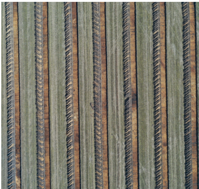
ARV 544 Damgård, dronfoto - snorlige søgegrøfter.

modning. Udover enkelte recente grøfter, var samtlige søgegrøfter fundtomme. Forundersøgelsen er betalt af bygherre. Udgravningsleder Esben Schlosser Mauritsen.