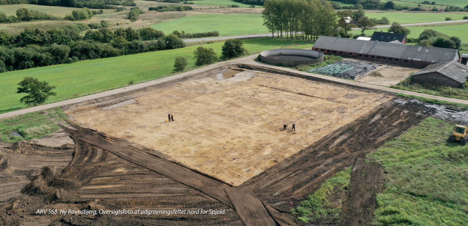
ARV 568. Ny Ravnsbjerg, Oversigtsfoto af udgravningsfeltet nord for Spjald.