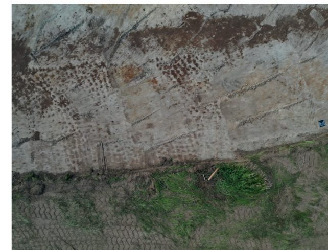
ARV 509, Ho. Dronefoto. I øverste, venstre hjørne ses et område af kálhaven, hvor talrige spadestik tegner sig tydeligt i det lyse fygesand.