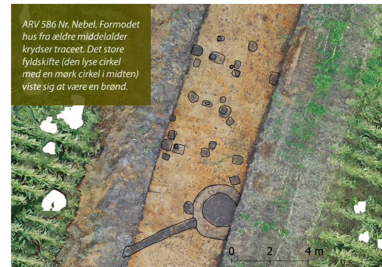
ARV 586 Nr. Nebel. Formodet hus fra ældre middelalder krydser traceet. Det store fyldskifte (den lyse cirkel med en mørk cirkel i midten) viste sig at være en brønd.