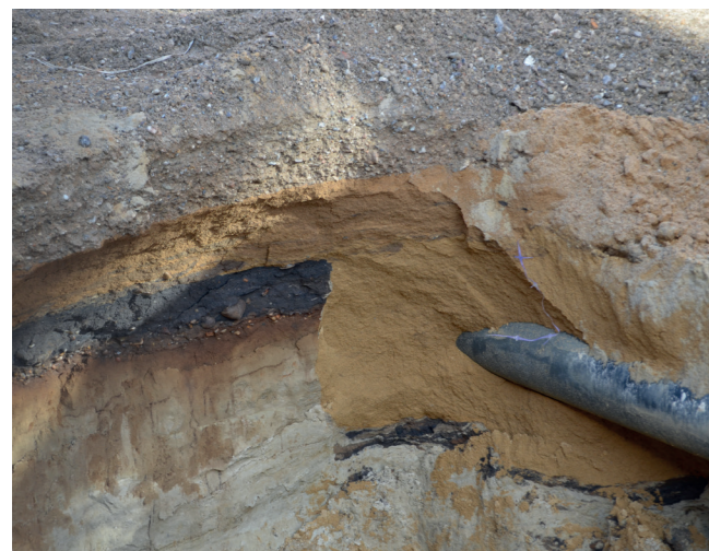
ARV 537. Betingelserne i Ringkøbing betyder, at man ofte må forsøge at få meget ud af lidt. På billedet ses et vejlag, som til højre er gennemgravet af en fjernvarmegrøft. De øverste dele af laget er gravet bort i forbindelse med anlæggelse af vejbelægninger i nyere tid.

Forundersøgelse forud for anden etape af cykelsti fra Skjern til Faster. Umiddelbart øst for kirkeåen blev der fundet rester af en savet træbro fra nyere tid. På de historiske kort fra 1842-1899 ses ingen vej over åen på det pågældende sted, mens den optræder på de senere kort fra 1901-1971. Derfor formoder vi, at træbroen er opført i denne periode. Forundersøgelsen er betalt af bygherre. Udgravningsleder Rachel Thy Facius.