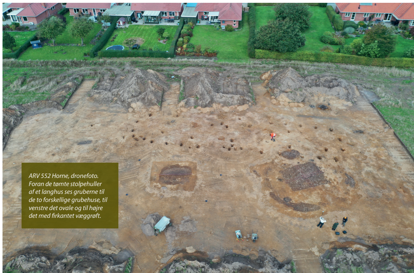
ARV 552 Horne, dronefoto. Foran de tomte stolpehuller af et langhus ses gruberne til de to forskellige grubehuse, til venstre det ovale og til højre det med firkantet vægggrøft.

midt i grubehuset lå en tenvægt. Helt ekstraordinært lå her også skår af importkeramik, hvilket viser, at det var folk af en vis status og med udenlandske forbindelser, der boede her. Det andet grubehus havde en firkantet vægggrøft i bunden af gruben. Her var der tagbærende stolper både i gavlen og i hjørnerne. I grubehusets østende var der spor efter et ildsted og en ovn af ler. Udgravningen er betalt af Din forsyning. Udgravningsleder Lene B. Frandsen.