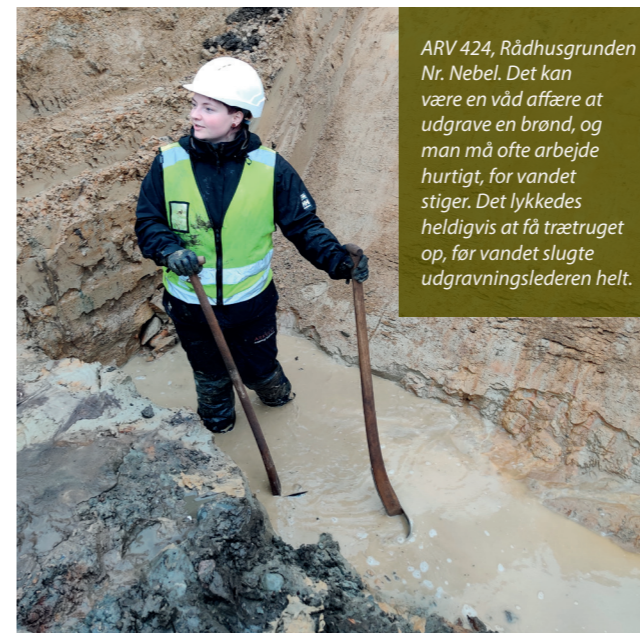
ARV 424, Rådhusgrunden Nr. Nebel. Det kan være en våd affære at udgrave en brønd, og man må ofte arbejde hurtigt, for vandet stiger. Det lykkedes heldigvis at få trætrug op, før vandet slugte udgravningslederen helt.