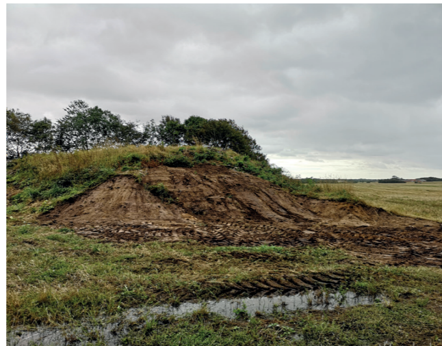
ARV 576. Krophøj efter reetablering. Når græsset gror op, skal den nok blive fin.

ARV 592 Ølstrupvej, Lybæk. Oversigtsplan af hele forundersøgelsens areal samt zoom på huset.