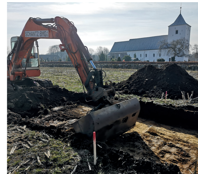
ARV 508. Afgravning af cykelstirace – Outrup kirke i baggrunden.

Et flerårigt projekt er i år afsluttet. Siden 2017 har ArkVest ført løbende tilsyn med kloakering i Varde midtby. Der er registreret en del profiler og profil-stykker i både vejene og stikledninger til de enkelte matrikler. Arbejdsforholdene er ikke altid optimale, og det er langt fra alle steder, der er bevarede kulturlag. Det generelle indtryk af Varde er efterhånden, at der ikke er kulturlag bevaret ret mange steder i den centrale del af byen, hvor der i nyere tid har været megen graveaktivitet – det gælder for eksempel i gaderne. Det gør det ikke mindre vigtigt at følge anlægsarbejderne for at dokumentere det, der er tilbage. Undersøgelsen er betalt af Varde Kommune. Udgravningsleder Lars Chr. Bentsen.