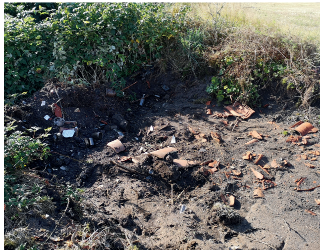
ARV 576. Krophøj - store mængder affald gravet ned i kanten af højene.

Oprydningen blev iværksat d. 13. september 2022, hvor flere af beboerne hjalp til. Knudehøj var hurtigt klar til takket være de lokale, som i forvejen havde fjernet alt det overfladiske i form af gammelt jern, beton og løse sten. Under overvågning blev en bunke løs jord fjernet fra højens kant og brugt til at reparere et kørespor. Krophøj var noget mere problematisk og omfanget af problemet med affald var større end først antaget. Et skrab af rendegraven afslørede, at der lå en bunke affald i højens nordlige udkant. Det blev besluttet at fjerne alt affaldet, og der blev tilkaldt en ladvogn til at hælde det op på. Under arbejdet blev glas og metal sorteret fra til genbrugsstationen. Affaldet synes at være ca. 50 år gammelt. Det viste sig, at man havde gravet et dybt hul uden for højfoden og smidt