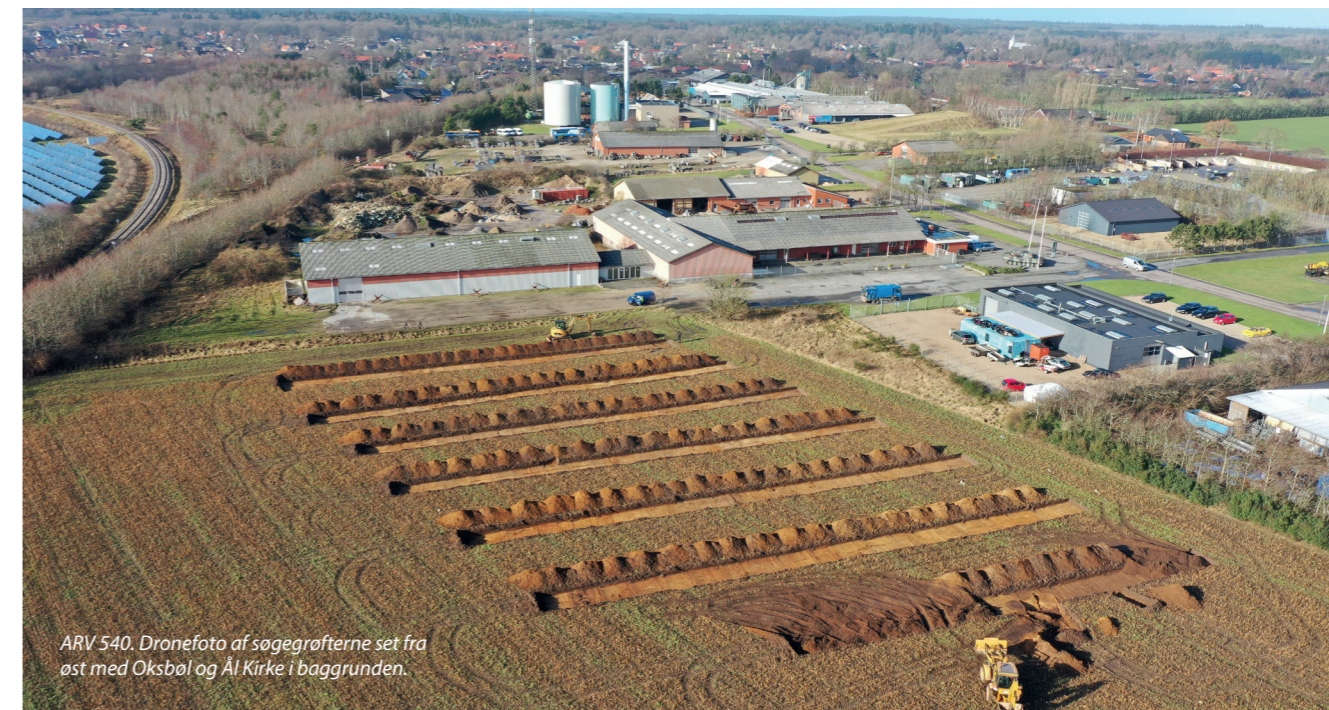
ARV 540. Dronefoto af søgegrøfterne set fra øst med Oksbøl og Ål Kirke i baggrunden.