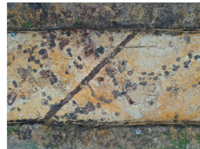
ARV 586 Nr. Nebel. Dronebillede af bygningsudsnit fra ældre vikingetid i minimum to faser. Der er tale om et "cigarformet" hus.

ArkVest iværksatte i august 2022 en forundersøgelse i forbindelse med etablering af et regnvandsbassin syd for Horne. Der blev undersøgt ca. 1,4 ha. På det højst beliggende område tæt ved parcelhusområdet Klokkedoj fandtes adskillige stolpespor og et grubehus. Keramikken kunne dateres til vikingetid. Der er flere kendte fund fra vikingetiden i Horne og omegn. På kirkegården står en runesten og mod øst, ved Hornelund, er der i 1892 pløjet et spektakulært guldfund op – Hornelundspænderne. På samme mark blev der i 2014 gjort et skattefund i form af et fragment af en guldarmring og 24 sølv mønter. Området