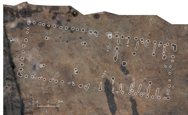
ARV 568. Ny Ravnsbjerg. Grundplanen af et hus fra førromersk jernalder. Her er stolpehullerne optegnet på et dronefoto af udgravningsfladen. I husets vestlige ende har været beboelse, mens husets østlige ende har fungeret som stal. Her ses resterne af båseskullerummene, hvor dyrene har stået.

grundplanen til et eller flere toskibede huse fra samme periode (3900 - 1700 f.v.t.). Herudover blev der delvist udgravet to hustomter fra ældre bronzealder (1700 - 1000 f.v.t.) og en enkelt hustomt fra førromersk jernalder (500 f.v.t. - 0). Udgravningen er betalt af bygherre. Udgravningsleder Rachel Thy Facius.