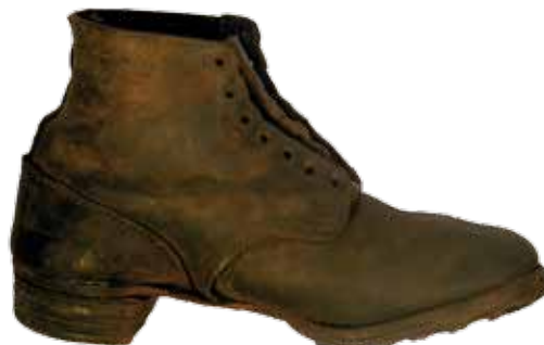
Tysk feltstøvle med 63 år i mudder og saltvand på bagen. Mon den var med på den våde mørke tur fra Ringkøbing til Houvig den aften i januar 1945?

der stod en brændeovn midt på gulvet. Gentagne gange prøvede vi at få fat i vores brændselsration. Med kolde fødder og stivfrosne fingre tog vi så affære og begav os af sted selv for at finde noget brændbart. I en smadret barak i nærheden uden døre og vinduer fandt vi træ – planker af allerede ødelagte gulve – og kort tid efter brændte der en varmende ild i vores barakovn. Dråberne af den is, der tøede på vinduerne, frøs dog straks igen på det kolde gulv.