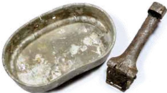
Udgravningen af Saalfelds bunker gav ingen feltflasker, men vi fandt en lille tallerken fra det tyske militærs almindelige feltudstyr.