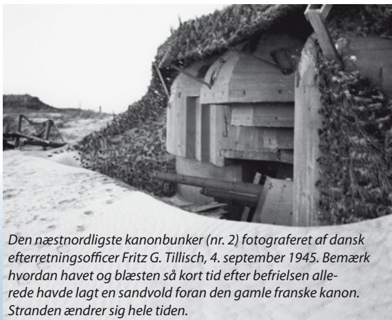
Den næstnordligste kanonbunker (nr. 2) fotograferet af dansk efterretningsofficer Fritz G. Tillisch, 4. september 1945. Bemærk hvordan havet og blæsten så kort tid efter befrielsen allerede havde lagt en sandvold foran den gamle franske kanon. Stranden ændrer sig hele tiden.