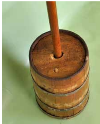
Det gamle samfunds magiske forestillinger om lykke og arbejde var ikke mindst knyttet til brød, øl og smør. I udstillingen på Bundsbæk Mølle kan man se et hjørne med genstande og film fra det åbne ildsteds køkken.