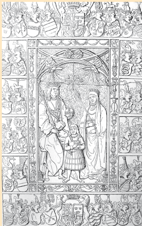
Kong Hans' ligsten.

gamle og for nutidsmennesket helt fremmedartede lykkeforestillinger ikke kun en rolle i fortidens almindelige landsbyliv. Måske var også magt og politik styret af magiske lykkeforestillinger. 11