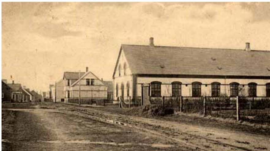
I dag er der stadig tre aktive missionshuse i Skjern. Et af dem er Luthersk Missionsforenings, her fotograferet dengang gaden stadig ikke var andet end et mudret hjulspor.

Vækkelsesbølgen i Skjern var en af de mere markante, men både Indre Mission og grundtvigianismen vandt frem overalt i disse år. Og ligesom erhverv og økonomi stillede