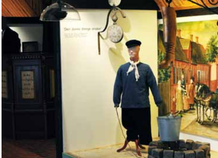
Folkeeventyret var mediet for drømmen om pludselig lykke i det gamle samfund. I udstillingen på Bundsbæk Mølle kan man høre eventyr foran tableauer som dette.