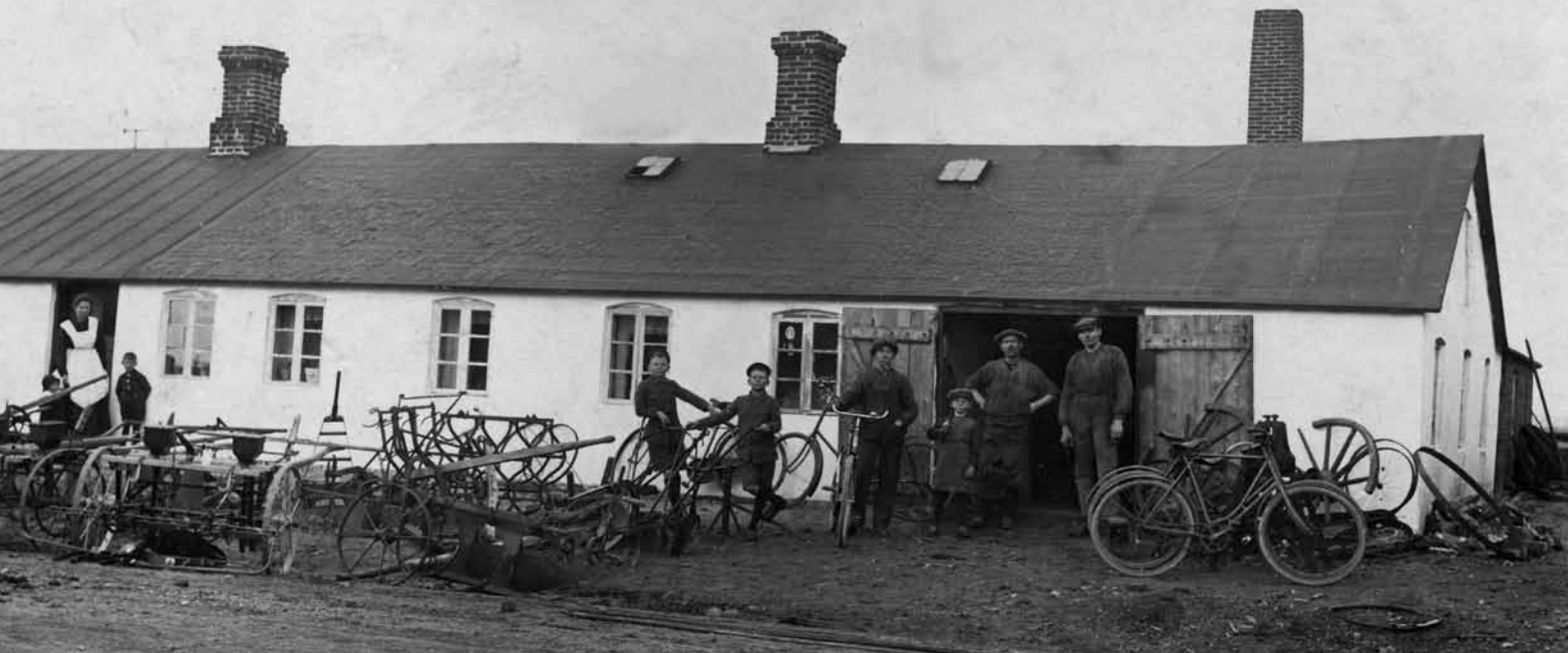
En ny tids effektive landbrugsmaskiner og det nye transportmiddel, cyklen, hos smeden i Stauning engang omkring år 1900.

type, der har præget landsdelen siden, sin entré i Vestjylland: Iværksætteren. Iværksætter skal her forstås i bred forstand. Det var spekulanten, der købte hede og udstykkede parceller. Det var håndværkeren eller handelsmanden, der etablerede