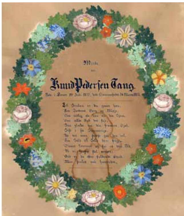
I 1800-tallets sidste årtier blev de såkaldte mindevers moderne. Den dødes liv blev refereret, og døden blev beskrevet som en udfrielse fra jordelivets sorg og møje. Verset på billedet er et meget tidligt eksemplar fra 1853.

Til Himlen er du gaaet hen, Fra Jordens Sorg og Møje, Saa tidlig alt hen til dit Hjem, Saa vilde Gud det føje; Han glæde nu din fromme Sjæl, Hist i sit Himmerige, At det maa stedse gaa den vel, Fra Held til Held den stige. Snart kommer og for os den Tid, At vi herfra skal vandre; Gid vi da efter fuldendt Strid, Maa samles med hverandre.