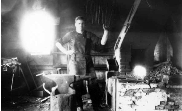
Smeden – manden der kan forme det hårde jern – har altid været lidt af en trolldmand i den folkelige forestilling.

Midt i al den nye dynamik var der penge at tjene for dem, der forstod at gribe chancen. I årene omkring 1900 gjorde en ny