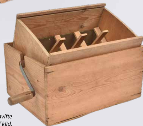
Hjemmelavet kornvifte til sortering af klid.