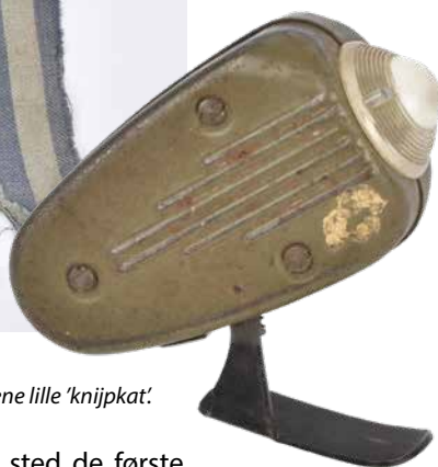
Den ene lille 'knijpkat'.

og norske fanger hjem. Aktionerne fandt sted de første måneder i 1945. Historien fortæller, at kriminaloverbetjentens søn ikke vidste, faderen havde hjembragt ærmet, før han så den i udstillingen på Ringkøbing Museum i 1995.