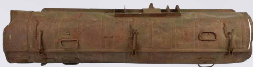
Nedkastningscontainer med rum til våben og sprængstoffer, opsamlet af modstandsbevægelsen efter nedkastning fra engelske fly.