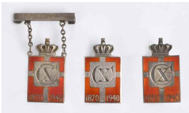
Tre eksempler på kongeemblemet – fra venstre er det damemodellen, herremodellen og universalmodellen.

Dette mærke var tegnet af Arno Malinowski og kom til salg i landets guldsmedeforretninger fra august 1940. Emblemet blev lavet i en herremodel til knaphullet, en kvindemodell med kæde og bjælke med nål, samt en universalmodel med nål. Sammen med den udgave, der kom i anledningen af kongens 75-års fødselsdag med årstallet 1870-1945, endte emblemerne med at være solgt i over 1 million eksemplarer frem til kongens død i 1947, hvor salget stoppede. Samlet set indbragte salget af kongemærket og konge-emblemet over 1,8 millioner kr. til fonden, som eksisterer den dag i dag.