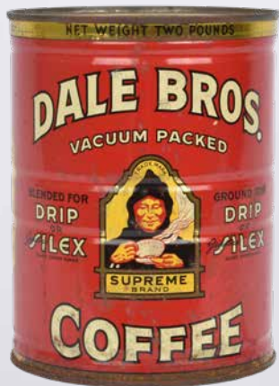
Den uåbnede kaffedåse kaffe fra USA.