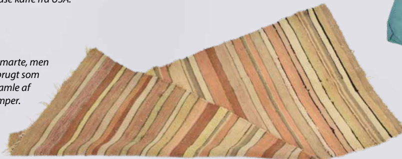
Det måske mindre smarte, men funktionelle tæppe brugt som gulvløber lavet af gamle af silkestrømper.