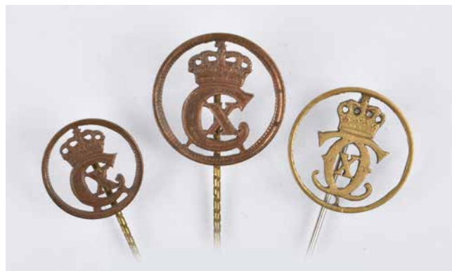
Tre eksempler på mønter omlavet til kongemærker.

Det blev fem lange år, der tærede på den danske befolkning. Der var knaphed på meget, især på luksusvarer, som