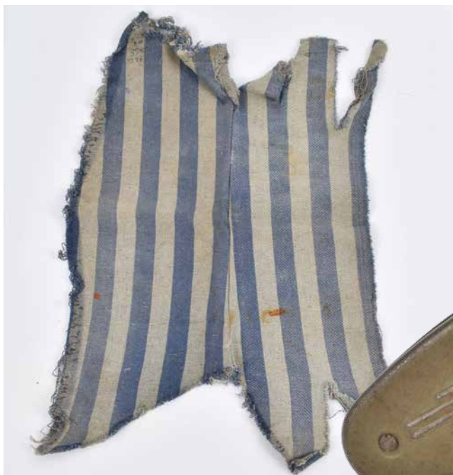
Ærmet med den barske historie.