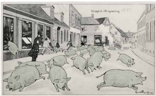
Det farvelagte postkort med grønne grise (tyske soldater) løbende rundt i gaden.