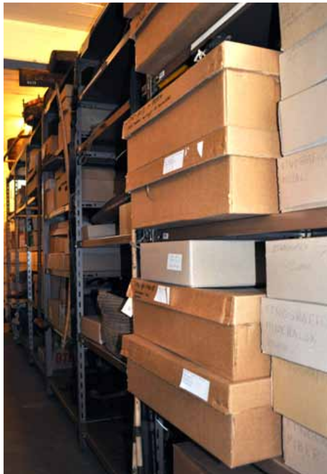
Et lille kig bag kulisserne på Ringkøbing-Skjern Museum.

I 2007 smeltede Ringkøbing Museum og Skjern-Egved Museum sammen til Ringkøbing-Skjern Museum. Med 100 års indsamling på bagen er sådan en fusion lettere sagt end gjort. For et museum samler ikke kun på ting og sager. Det samler lige så meget på oplysninger om ting og sager. Når det kommer til at