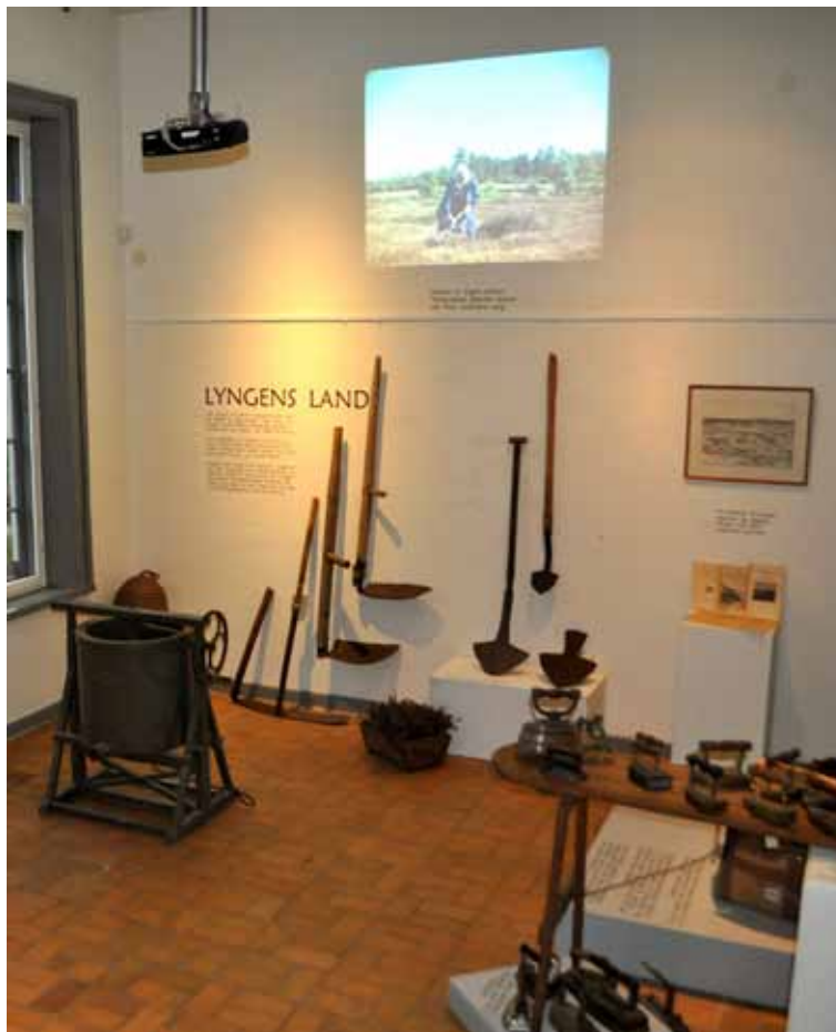
To gamle nyheder: Madpakker til de døde og Lyngens land.