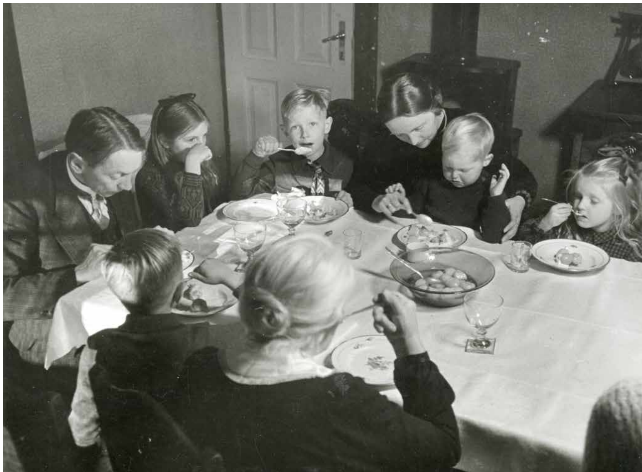
Familien Munk ved middagsbordet.