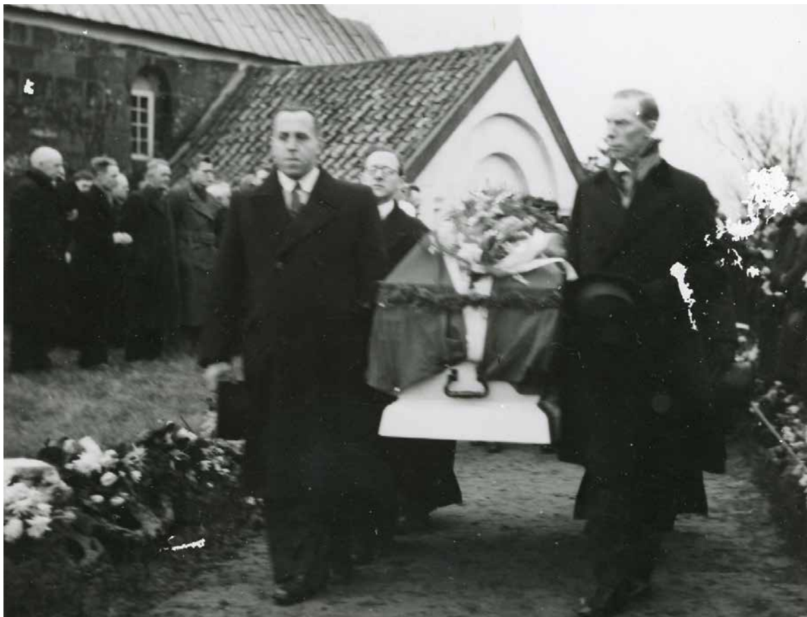
Fra Kaj Munks begravelse, hvor kisten er svøbt i Dannebrog.