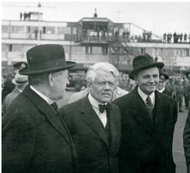
Statsminister Vilhelm Buhl, udenrigsminister John Christmas Møller og forsvarsminister Ole Bjørn Kraft (til højre).