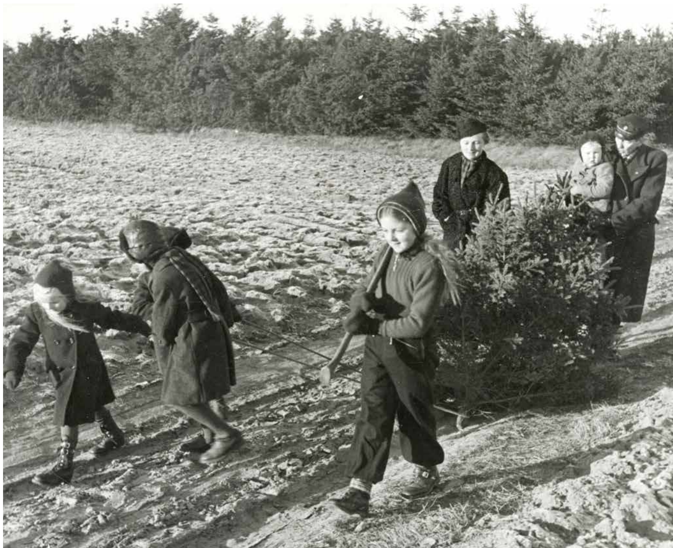
Billedet af familien Munk med deres juletræ stammer fra en artikel, Kaj Munk skrev til Billed-Bladet i 1940.