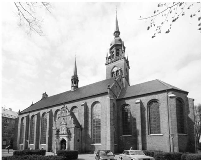
Helligåndskirken i København.

Nu var det blevet for meget for Werner Best. Aftenen før Kaj Munk skulle tale i Helligåndskirken, modtog han et direkte forbud fra Werner Best. Munk selv så stort på forbuddet og var klar til at fortsætte. Men efter en diskussion mellem biskoppen, Helligåndskirkens præst og Munk selv blev det alligevel vedtaget at aflyse gudstjenesten.