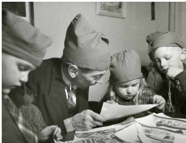
Billedet af Kaj Munk, der julehygger med børnene, er fra en artikel, Kaj Munk skrev til Billed-Bladet i 1940.

Sådan startede Kaj Munk sin juleprædiken i Vedersø og artiklen over samme prædiken i Jyllands-Posten 25. december 1943. Trods presseensuren var det altså i orden for en præst at få trykt sin juleprædiken.