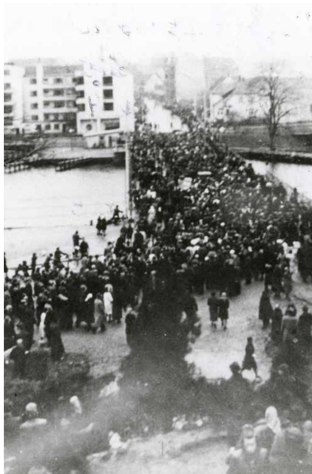
I tusindvis tog afsked med Kaj Munk.

Pastorens menighed var mødt talstærkt op. Kaj Munks kiste skulle egentlig stilles i kapellet, men med alle de mennesker, der ønskede at sige farvel, blev kisten stillet i kirken – her hvor Kaj Munk få dage tidligere havde talt. 55