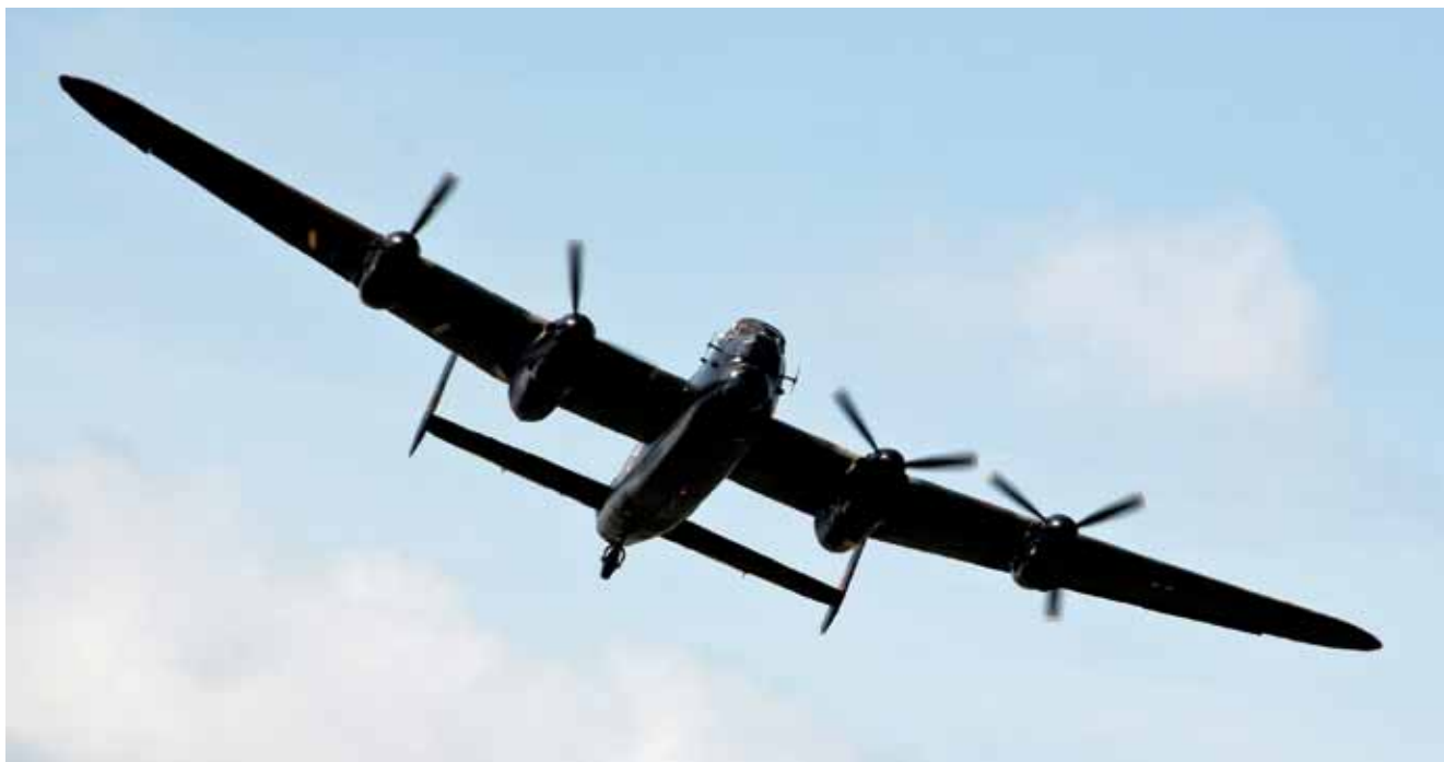
Briterne har endnu en flyvende Avro Lancaster. Her drøner den i lav højde over flyvergraven ved Stadil den 5. maj 2011.

Især i Vestjylland er Anden Verdenskrig historien om krigen, der fyldte meget, men som aldrig for alvor brød