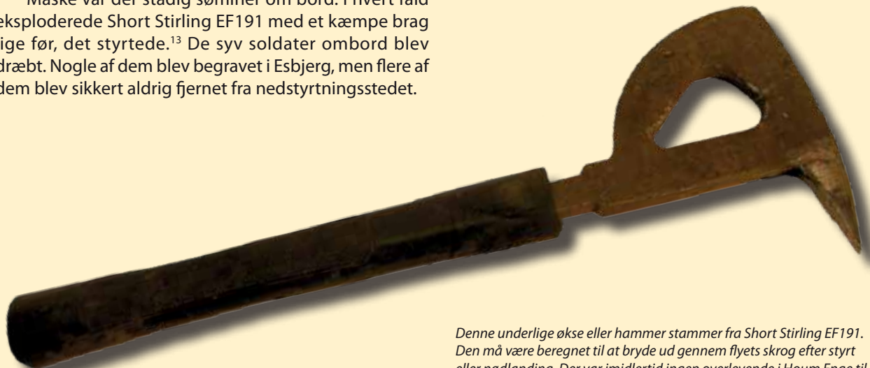
Denne underlige økse eller hammer stammer fra Short Stirling EF191. Den må være beregnet til at bryde ud gennem flyets skrog efter styrt eller nødlanding. Der var imidlertid ingen overlevende i Houm Enge til at bruge øksen den nat, og den blev fundet langt fra nedstyrtningsstedet.

Efter krigen blev stedet, hvor Short Stirling EF191 styrtede ned, gjort til en mindelund. Man kan stadig besøge flyvergraven, hvor man kan se det hul, flyet lavede, da det styrtede. Der er rejst en mindesten, og man kan se flere stykker af det smadrede bombefly.