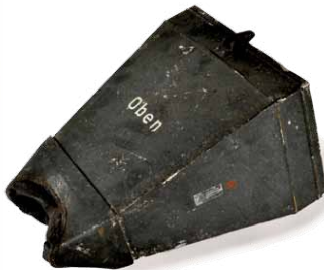
Når de tyske teknikere skulle aflæse radarerne, holdt de særlige briller, nærmest kasser for øjnene.