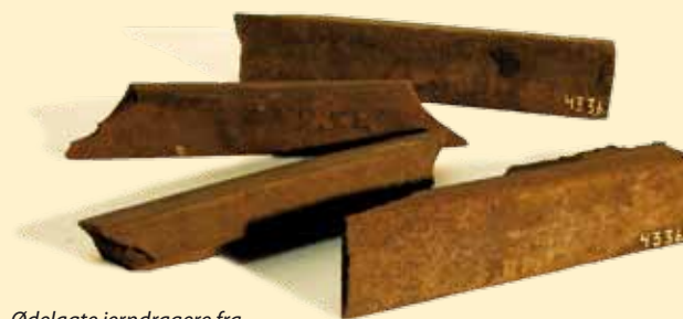
Ødelagte jerndragere fra svineslagteriet i Skjern.

kunne se ham. Han vinkede for at få folk til at løbe væk, men de fleste misforstod ham. De vinkede bare tilbage. Så måtte piloten smide bomberne. Mens lufttrykket fra eksplosionen smadrede ruder i store dele af byen, og slagteriets ødelagte køleanlæg indhyllede et stort område i en stank af ammoniak, forstod Skjern-borgerne, at krig er alvor. 8