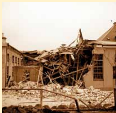
Som altid, når der skete noget dramatisk i Skjern, var fotograf Graversen på pletten med sit kamera.