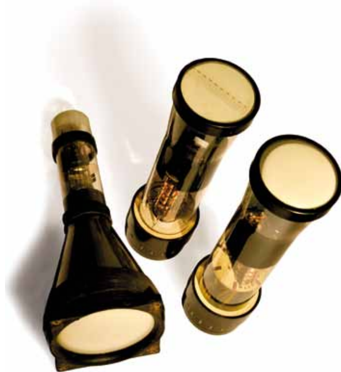
Radorør fra tyske radarer i Ringelnatter.

Trods de tre kupler med i alt otte maskingeværer var en Lancaster aldrig i sikkerhed over Vestjylland. Fra radarstillinger på kysten fulgte tyskerne med i de britiske bombeflys flyvninger. Tyskerne havde både radarer, der kunne afsøge havet bredt, og andre radarer, der kunne følge flyene, når de først var opdaget. Fra Luftwaffes store radarstilling Ringelnatter lige ved Krylestillingen nord for Ringkøbing, blev natjagerne beordret på vingerne fra Flieghorst Grove (nu Karup Lufthavn). Ved hjælp af radar og radiokontakt blev de ført frem til nærkamp. Mange britiske fly blev ramt, og de stolte kæmper styrtede ned. 2