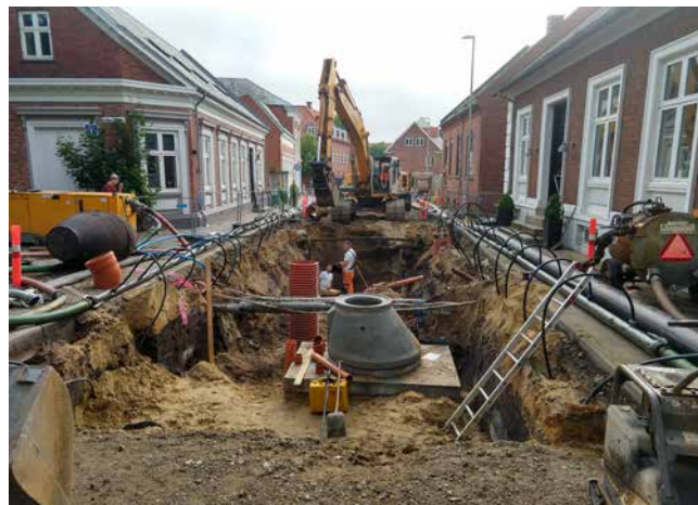
ARV 503. Kloakgravning i Slotsgade, Varde. Det kan være en kompliceret opgave at hitte rede i nye og gamle nedgravninger.

Udgravning på foranledning af en detektorfundet møntskat. På baggrund af fundet af 24 sølvmønter fra første halvdel af 1600-tallet blev en udgravning iværksat med håbet om at kunne lokalisere en nedlægningskontekst samt at sikre eventuelle flere mønter. Mønterne var