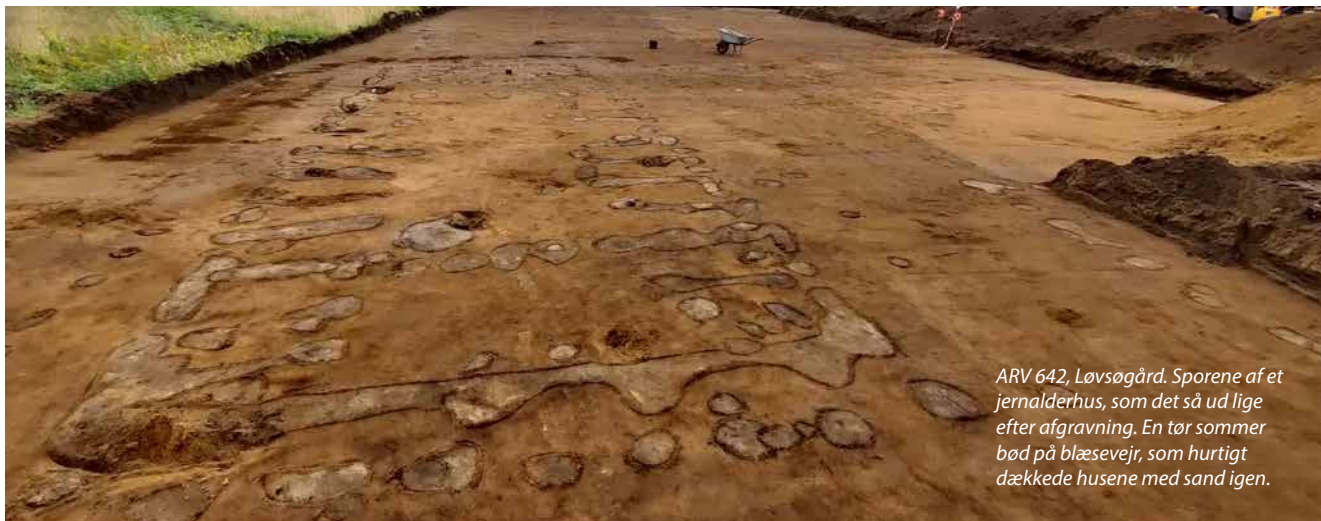
ARV 642, Løvsøgård. Sporene af et jernalderhus, som det så ud lige efter afgravning. En tør sommer bød på blæsevej, som hurtigt dækkede husene med sand igen.

fundet keramik, heriblandt et stykke med ornamentik, som umiddelbart dateres til ældre førromersk jernalder. Syd for huset blev fundet et område med ardspor. Forundersøgelse og udgravning betalt af Ringkøbing-Skjern Kommune. Udgravningsleder: Sara Hjöllund Sørensen.