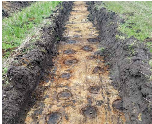
ARV 620. Videbæk. Flere rækker af åbentstående huller- et såkaldt hulbælte.

ArkVest har fra august til november fulgt nedlæggelsen af et nyt elkabel rundt om Videbæk, en strækning på