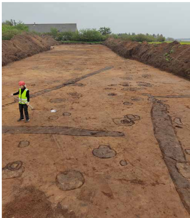
ARV 629. Ho Bugt Vej. Sporene af de store stolper, som engang har båret vægge og tag i flere generationer af middelalderbygninger.

Forundersøgelse og udgravning forud for etablering af jordvarmeanlæg. Der er i alt undersøgt knapt 4.000 m 2 , og den primære bebyggelse på lokaliteten dateres til middelalder. Det formodes, at der har været beboelse på lokaliteten i flere generationer, da nye huse er genopført