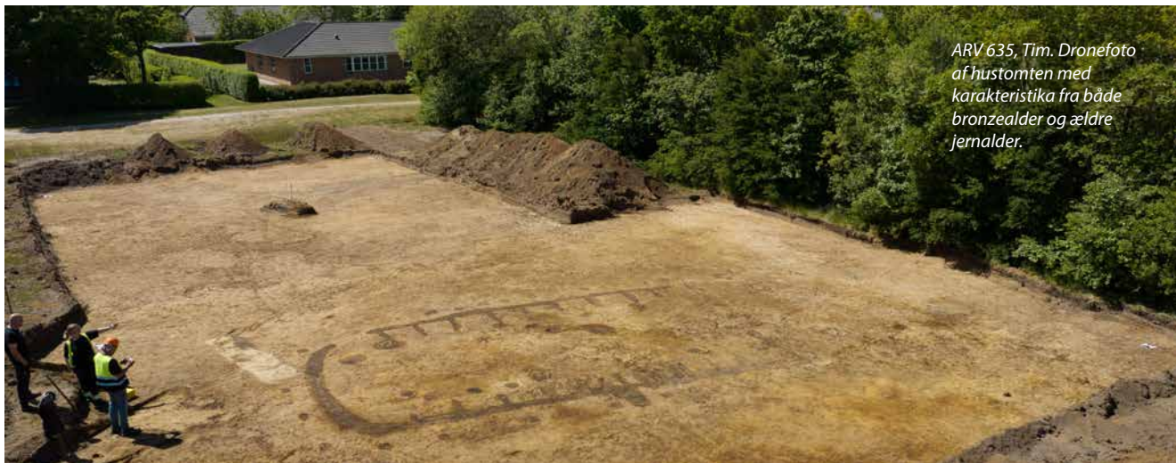
ARV 635, Tim. Dronefoto af hustomten med karakteristika fra både bronzealder og ældre jernalder.

Forundersøgelse af et areal på ca. 10.332 m 2 forud for byggemodning ved Toftevej i Tim førte til en udgravning af et område på ca. 631 m 2 . På arealet blev fundet en hustomt, sandsynligvis fra overgangen mellem yngre bronzealder og ældre førromersk jernalder. Hustomten er meget velbevaret. Den er bemærkelsesværdig ved at have væggrøft med udvendige stolper, hvilket normalt ses på huse fra førromersk jernalder, men samtidig er huset meget bredt – 6 m, hvilket er mere almindeligt for hustomter fra bronzealderen. I hustomten blev