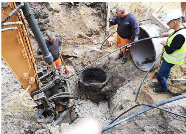
ARV 503. Torvegade i Varde, her fandtes en brønd lige midt i kloakgrøften.

Overvågning af gravning forud for nedlægning af ny kloak i Varde by. I østenden af Slotsgade fremkom rester af brokkelag og middelalderlige bebyggelsesspor. Særligt i området omkring Rådhusstræde var der mange anlægsspor i profilerne både i nord- og sydside af Slotsgade.