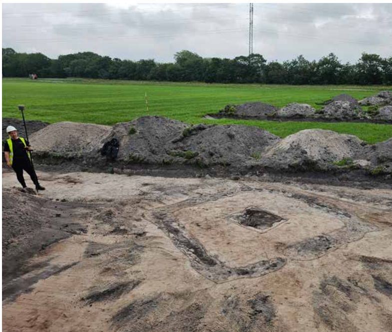
ARV 609, Stoustrup. Rektangulære og firkantede grøfter med tørv. Uvis funktion.