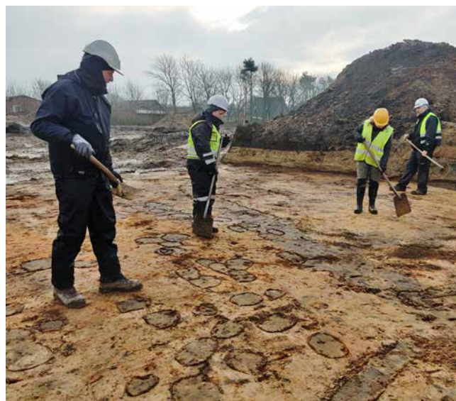
Rådhusgrunden, Nr. Nebel. En kold januardag. I undergrunden anes de mange stolpehuller, som knyttes til bebyggelsen fra germansk jernalder (375-700 e.v.t.).

Udgravning forud for etablering af byggegrunde. Undersøgelsen blev påbegyndt i oktober 2022 og afsluttet i januar 2023. Det fulde undersøgelsesområde