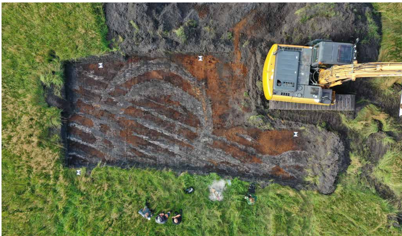
ARV 670, Ulvemose. Ringgrøfter, med overliggende pløjespor.

Forundersøgelse på et omtrent 1.579 m 2 stort areal forud for opførelse af et maskinhus ved Ølstrup. På stykket fremkom enkelte stolpehuller, som stod spredt i feltet, samt en grube. Stykket blev frigivet umiddelbart efter forundersøgelsens afslutning. Forundersøgelse betalt af ArkVest. Udgravningsleder: Sara Hjøllund Sørensen.