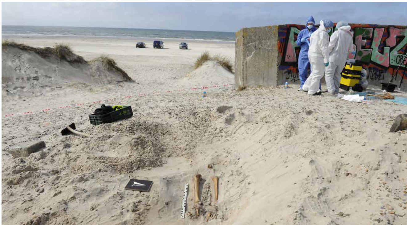
ARV 652. Retsmedicinere arbejder på Børsmose Strand.

Forundersøgelse og overvågning i forbindelse med ny kloak i Næsbjerg. Der er fremkommet et mindre område med bebyggelsesspor fra middelalder eller renæssance. At vi støder på bebyggelse på netop det sted, er ikke helt tilfældigt. Området er matrikel 1a, altså den ældste matrikel og præstegårdens jord og har stednavnet "Kirkegaarde". Der er fundet spor af fire bygninger i alt, to staklader og to større bygninger. Området er indstillet til udgravning. Forundersøgelsen er betalt af bygherre. Udgravningsleder: Jens G. Lauridsen.