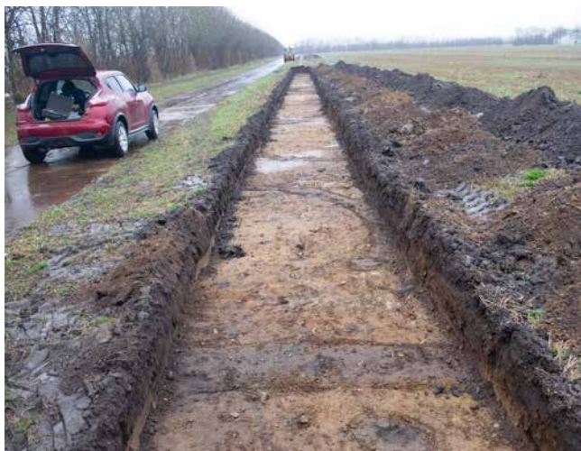
ARV 439, tuegravpladsen i Årre. Kabelgrøften skærer tværs igennem flere ringgrøfter. Trist syn fordi ringgrøfterne er så nedpløjede. Der er snart ikke mere tilbage af den kæmpestore gravplads.

Forundersøgelse og udgravning af tracé for 60 KV-ledning, foretaget af ArkVest i 2022 og 2023. Tracéet passerer den velkendte Årre tuegravplads, der har rummet