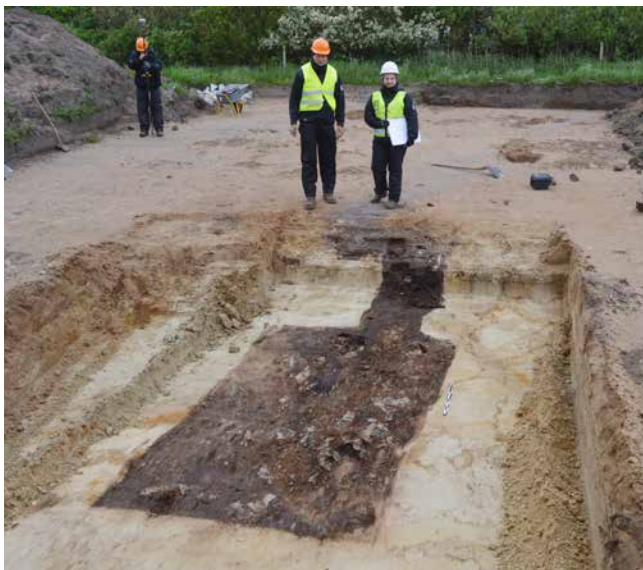
ARV 629. Ho Bugt Vej. Udgravning af en lille kælderkonstruktion tilhørende et middelalderhus. Kælderen har været delvist konstrueret med tørv, og den smalle grøft, som her ses i toppen af den firkantede kælder, er resterne af en trappe eller nedgang.

på samme byggegrund af adskillige omgange. Et nævneværdigt anlæg fra middelalderbebyggelsen er en kælderkonstruktion med en stensat trappeskakt, hvor selve kælderen delvist har været konstrueret med en væg af klægtørv og et gulv bestående af vendt græstørv.